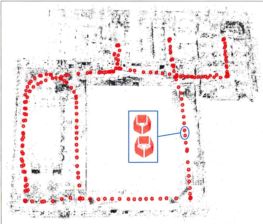
Abb. 2: Untersuchungsgebiet im alten FHNW-Hauptgebäude in Muttenz mit georeferenzierten Mobile-Mapping-Bildern (rot) und 3D-Verknüpfungspunkten (schwarz), resultierend aus COLMAP, einer modifizierten Bündelblockausgleichungspipeline (Cavegn et al., 2018).

SE-Wert für 3D Kontrollpunkt-Residuen zwischen SLAM und Tachymetrie von 133 mm berechnet. Für die mittlere Präzision der Vorwärtsschnitte von jeweils mindestens vier Beobachtungen zu jedem Kontrollpunkt wurde ein 3D-Wert von 123 mm für SLAM und ein 3D-Wert für die bildbasierte Georeferenzierung von 3 mm erreicht. Diese Werte repräsentieren das Genauigkeitspotenzial von relativen 3D-Distanzmessungen.