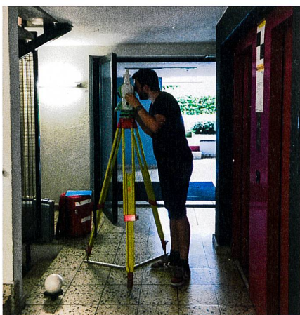
Fig. 3: Saisie classique des données. Abb. 3: Klassische Datenerfassung. Fig. 3: Rilevamento classico dei dati.

Cet algorithme utilise des données issues d'un capteur Lidar et d'une unité de mesure inertielle (ci-après appelée « IMU »). Une IMU est une combinaison de plusieurs capteurs inertiels qui sert à déterminer la direction spatiale, autrement dit l'orientation. Elle se compose généralement de trois accéléromètres posés les uns sur les autres de manière orthogonale, qui mesurent le mouvement (mesure +/- valeur U) et de trois gyromètres disposés les uns par rapport aux autres de manière orthogonale. Ces derniers mesurent les mouvements circulaires. L'IMU sert pour initialiser une position de départ et produire un nuage de points, dont les surfaces et les géométries seront extraites par la suite.