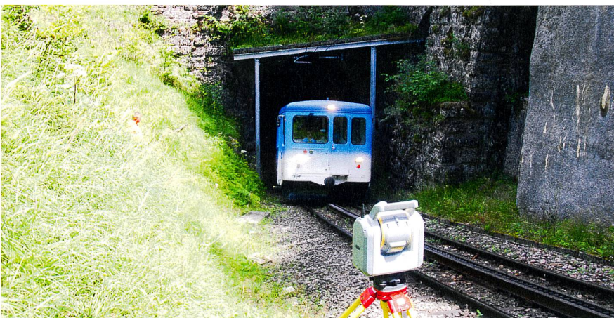
Abb. 1: Bergseitiges Tunnelportal des Schönenbodentunnels mit Schutzbau. Fig. 1: Entrée en amont du tunnel du Schönenboden avec ouvrage de protection.

Vor Ort wurde auch klar, dass für eine optimale Übersicht das Vermessungsinstrument immer in der Mitte des Gleises aufgestellt werden sollte. So kann man die beiden Seitenwände am besten erfassen