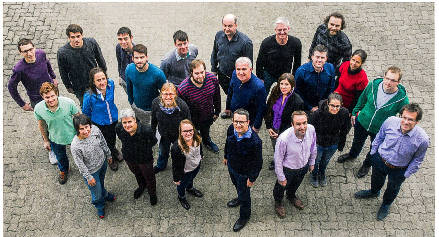
Das Team des Instituts Geomatik der FHNW (Nov. 2017).

Nach der Pensionierung mehrerer Professoren in den Jahren 2016 und 2017 ist das In-