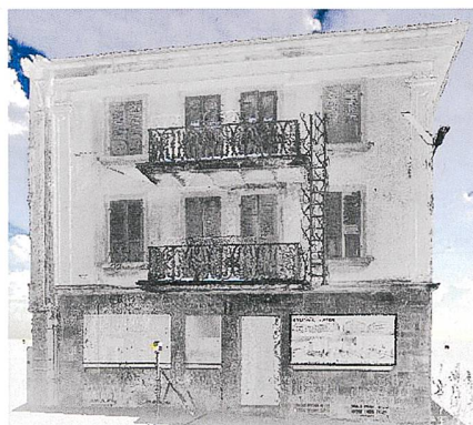
Fassadenaufnahme mit Laserscanning Punktwolke.