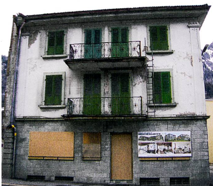
Abb. 1: Fassade.

Der Arbeitsprozess beim Scannen eines Objekts ist im Grunde genommen mit demjenigen einer Totalstation vergleichbar. Eine wichtige Komponente beim Scannen sind die Referenzpunkte, die es erlauben, die einzelnen Scans in das ein-