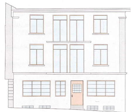
Fertig ausgewertete Fassade als dxf-Datei.