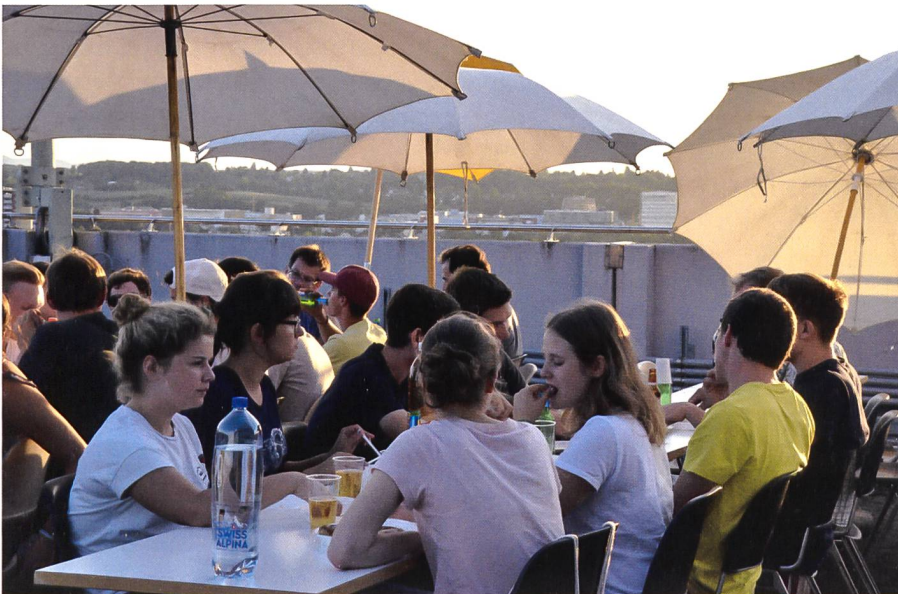
Geomatik-Grillabend auf dem FHNW-Dach mit Mess-Schirmen als Schattenspenden.