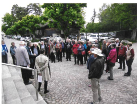
Abb. 1: Begrüssung im Bally-Park.

Zum Frühlingsanlass der Gruppe Senioren trafen sich 49 Teilnehmende, davon 16 Partnerinnen, im östlichsten Zipfel des Kantons Solothurn: in Schönenwerd. Auf dem Programm standen ein Besuch im Bally-Park und auf der Tunnelbaustelle Eppenberg, alternativ für weniger Bauinteressierte ein Besuch im Gugelmann Museum.