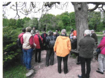
Abb. 3: Aufmerksame Zuhörer im Bally-Park.

etwa zwanzig Minuten zunächst steil bergauf, dann eben auf einem Waldweg und zum Schluss über unzählige Treppenstufen wieder hinunter zur Aussichtsplattform, von der man einen ausgezeichneten Blick auf die Baustelle der Tagbaustrecke des Eppenberg-Tunnels hat und die laufenden Bauarbeiten verfolgen kann. Nach kurzer Zeit war bereits der Rückweg angesagt, um den Bus zurück nach Schönenwerd und zum Schlussstrunk zu erreichen. Dieser Schlussstrunk fand wieder im Hotel Storchen statt. Begleitend zu einem Feierabendbier, einem Glas Wein oder Mineralwasser und Partybrötchen erzählten uns die Damen von ihrem Besuch im Gugelmann Museum und den dort ausgestellten poetischen Maschinen in Betrieb. Damit war der Schlusspunkt des diesjährigen Frühlingsanlasses der Gruppe Senioren erreicht; wiederum angereichert mit vielen gemütlichen, kollegialen Gesprächen mit bekannten und bisher unbekannten Personen. Die positiven Rückmeldungen lassen ohne weiteres den Schluss zu, dass solche Anlässe unter Senioren sehr geschätzt werden.