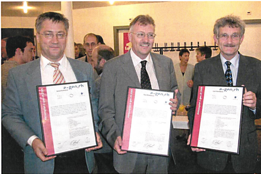
Abb. 2: Unterzeichnung Charta e-geo.ch, 2004. Fig. 2: Charte e-geo, signé 2004.

der Artikel 75a Vermessung in der Bundesverfassung mit folgendem Inhalt: