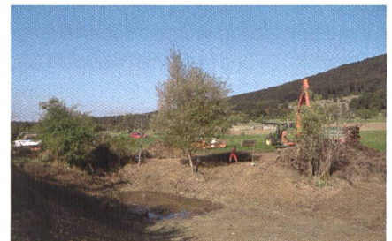
Abb. 1: Weiheranierung in der Gesamtmelioration Blauen BL, © LZ, Ressort Melioration.

Auf Initiative des Landwirtschaftlichen Zentrums Ebenrain (BL) wurde nun in Zusammenarbeit mit der ETH Zürich und dem Planungsbüro faktorgruen in Freiburg i.Br. (D) eine Methode entwickelt, die basierend auf einer Nutzwertanalyse dem Ist- und Planzustand einen ökologischen Wert zuordnet, der anschliessend in einer Bilanz verglichen werden kann. Die Methodik basiert auf einer Synthese von bestehenden Methoden, v.a. der Eingriffsregelung des gesamten deutschsprachigen Raums. Die entwickelte Methode berechnet für von Meliorationen betroffene Flächen über eine Exponentialfunktion einen allgemeinen Typuswert, der sich aus den Kriterien Natürlichkeit, allgemeine Gefährdung und Wiederherstellbarkeit ableitet. Dieser wird mit einem für jede Fläche individuellen Objektwert korrigiert, der sich über die Kriterien individuelle Gefährdung, Alter, Vernetzungsleistung und strukturelle