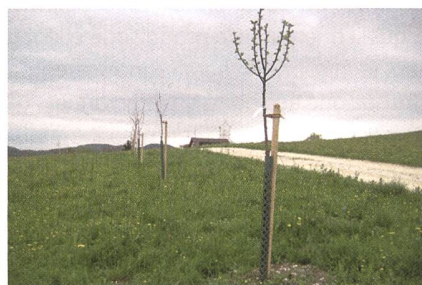
Abb. 3: Gesamtmelioration Roggenburg BL: Wie gross ist der naturschutzfachliche Wert einer neu gepflanzten Baumreihe?

(3) Die Nutzwertanalyse ermöglicht es grundsätzlich, durch die Melioration eliminierte Lebensräume mit anderen zu substituieren, wenn sie dieselben Punktezahlen ergeben. Beispielsweise liesse sich eine