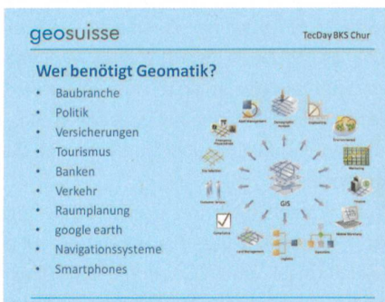
Abb. 2: Geomatikdaten werden von allen benötigt.