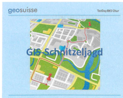
Abb. 3: Die GIS-Schnitzeljagd kann auf der Homepage von geosuisse abgerufen werden.