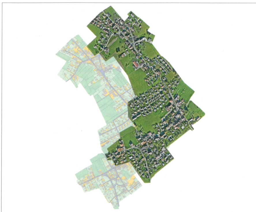
Fig. 1: Orthomosaïque produite par drone et le plan du registre foncier mis à jour. Abb. 1: Orthophotomosaik aus Drohnenaufnahmen und nachgeführtem Grundbuchplan.

Les deux objectifs du travail ont été d'évaluer les avantages et les désavantages de l'utilisation de SWISSIMAGE par rapport à une orthomosaïque produite par drone et d'analyser la précision