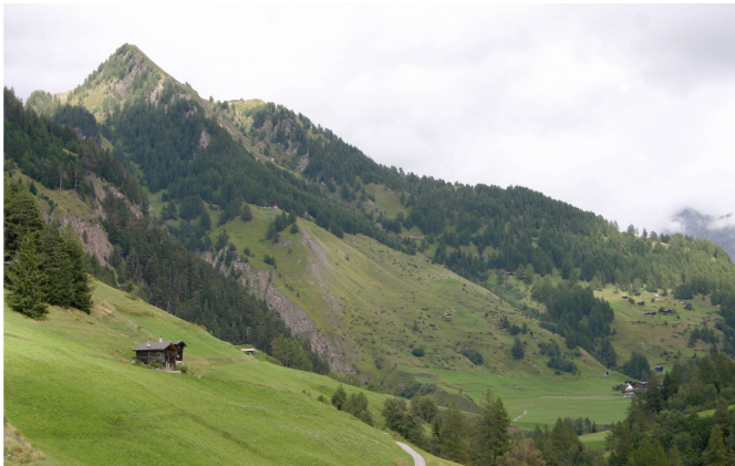
Abb. 5: Gepflegte Landschaft mit Blick auf den Weiler Imfeld.