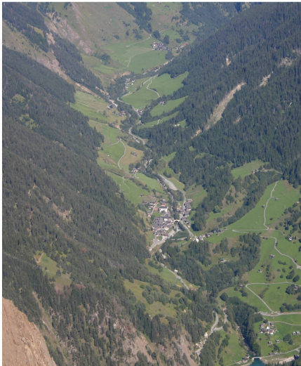
Abb. 2: Perimeter der Gesamtmelioration.

Schwierigkeiten bei der Gründung einer eigenen Familie seinen früheren Idealen untreu geworden ist».