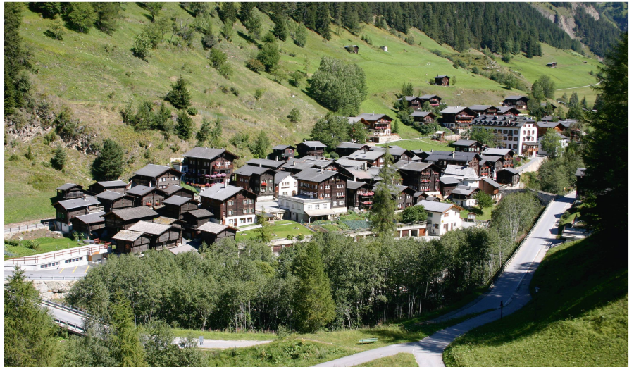
Abb. 3: Blick auf das Dorf Binn.

Im Jahr 1964 wurde ein grösserer Teil des Binn­tals in das Bundesinventar der Landschaften und Naturdenkmäler von nationaler Bedeutung (BLN) aufgenommen mit dem Ziel, den gegenwärtigen Zustand und die gegenwärtige Nutzung zu erhalten. Gemäss Klaus Aerni (Universität Bern) wurde im Nutzungszustand 1983 allerdings deutlich, wie sehr die Grenzen in Bewegung geraten sind zwischen Weide, Wald und dem eigentlichen Kulturland.