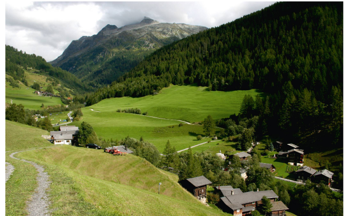
Abb. 6: Weiler Giessen und Weiler Imfeld im Hindergrund.

gut aufgestellt: Nach wie vor ist eine flächendeckende Bewirtschaftung vorhanden. Dazu tragen im Wesentlichen die vier Vollerwerbsbetriebe und ein Nebenerwerbsbetrieb bei. Die damals als zukunftssträftig betrachteten Betriebe bestehen nach wie vor, wobei ein Betrieb kürzlich an einen Nachfolger übertragen werden konnte. Die vier Betriebe weisen heute durchschnittlich 22.5 GVE und 32 ha auf.