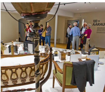
Abb. 8: Die neue Dauerausstellung «100x Aarau».

in Form von Video-Interviews greifen sechs zentrale Momente der Firmengeschichte auf. Daran lassen sich die Entwicklungslinien der Schweizer Industriegeschichte der letzten 150 Jahre ablesen: Beide beginnen sie als Handwerksbetriebe, wachsen mit dem Aufstieg der Industrie. Der Aufschwung wird durch den ersten Weltkrieg gestoppt. Es folgten für die exportorientierten Firmen turbulente, existenzbedrohende Jahrzehnte. Während des 2. Weltkrieges konnte Kern von Rüstungsaufträgen profitieren. In den 50er-Jahren erleben beide Firmen das so genannte Wirtschaftswunder, bevor in