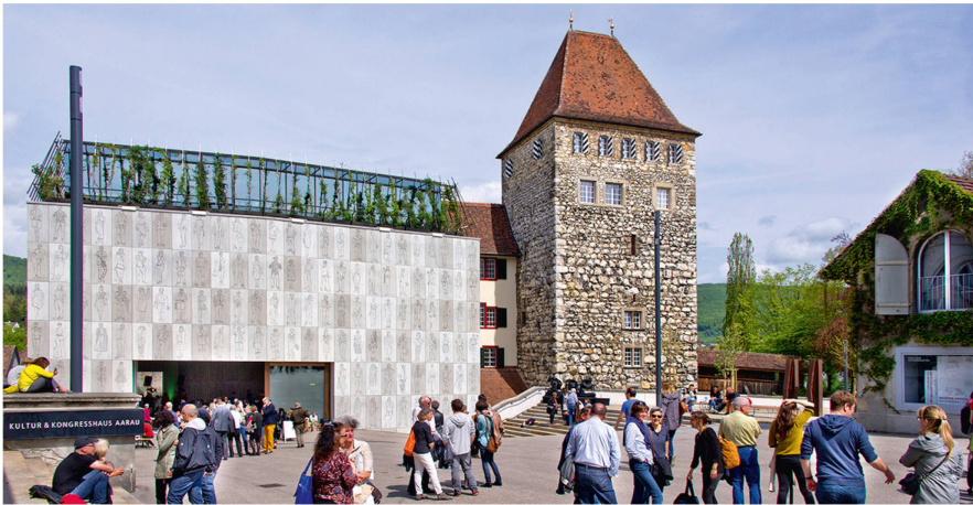
Abb. 1: Eröffnung Stadtmuseum Aarau, 26. April 2015.

zeuge, Maschinen und Geräte, verlangen spezielle Konzepte für die Infrastruktur. Die Kombination unterschiedlicher Materialien (z.B. Holz und Metall) sowie Grösse und Gewicht der Objekte erschweren die Erhaltung und erfordern oft Kompromisse. Weiter gilt zu entscheiden, ob das museale Interesse sich bei einigen dieser Objekte nicht nur auf die Erhaltung, sondern auch auf ihre Funktionsfähigkeit richten soll.