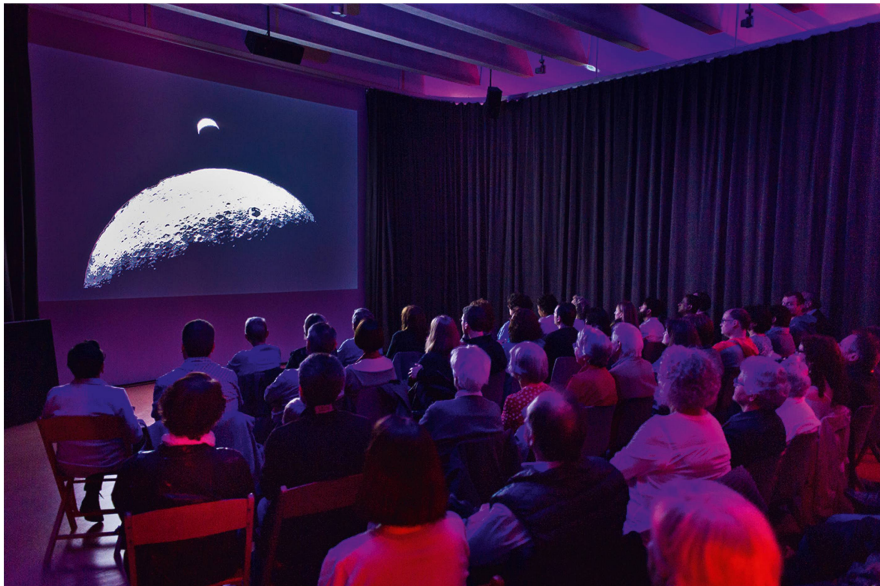
Abb. 7: Foto-und Filmraum im 2. UG des neuen Stadtmuseums, April 2015.