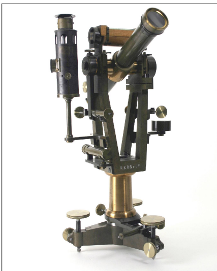
Abb. 2: Grosser Absteckungs-Theodolit für Simplontunnel, um 1898.

Wenn regelmässige Depotführungen angeboten werden oder ganze Teile als Schaudapot (oder Schaulager, oft synonym verwendet) ausgelegt werden, stel-