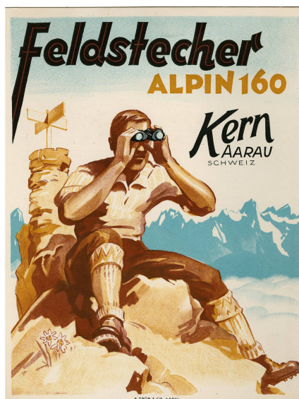
Abb. 9: Werbesteller für Feldstecher Kern, Lithografie auf Karton, um 1950.

in Form von Video-Interviews greifen sechs zentrale Momente der Firmengeschichte auf. Daran lassen sich die Entwicklungslinien der Schweizer Industriegeschichte der letzten 150 Jahre ablesen: Beide beginnen sie als Handwerksbetriebe, wachsen mit dem Aufstieg der Industrie. Der Aufschwung wird durch den ersten Weltkrieg gestoppt. Es folgten für die exportorientierten Firmen turbulente, existenzbedrohende Jahrzehnte. Während des 2. Weltkrieges konnte Kern von Rüstungsaufträgen profitieren. In den 50er-Jahren erleben beide Firmen das so genannte Wirtschaftswunder, bevor in