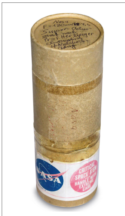
Abb. 5: Verpackung für eines von vier Spezialobjektiven (10-, 18-, 75- und 180-mm Brennweiten) für die Nasa, 1969.

lung liegt anderswo: In Alltagsgegenständen, Fotografie, Film, Grafik, Industriekultur. Die Recherchen brachten immer mehr Geschichten hervor. Dieser Schatz sollte für die Besucher sichtbar gemacht werden und als roter Faden durch die kleinräumige Struktur der Dauerausstellung führen. Daraus kristallisierte sich «100x Aarau» heraus: 100 Lebensgeschichten, von Bekannten und Unbekannten, vom Mittelalter bis heute. Die runde Zahl soll zeigen: Es gibt nicht DIE Geschichte von Aarau, sie besteht aus einer Vielzahl von Geschichten und funktioniert wie ein Kaleidoskop, jede Erzählung ist ein farbiger Splitter Aaraus. Auch Industriegeschichte besteht aus Geschichten von Menschen. Begeisterung für Entwicklung, Ängste und Frustration in Krisen sind prägende Gefühle bei den Mitarbeitern. Die Identifikation mit der Firma Kern ging weit über deren Existenz hinaus. Zusammen mit der Druckerei Trüb wird die «Kern und CO AG» im vierten Geschoss, im grössten Raum des Altbaus, präsentiert. Sechs Personengeschichten