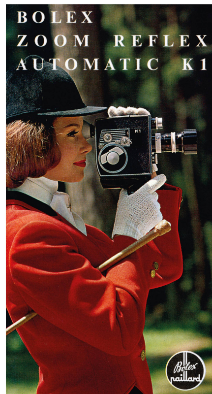
Abb. 6: Vorderseite eines Werbeflyers von Bolex Paillard, 1963.