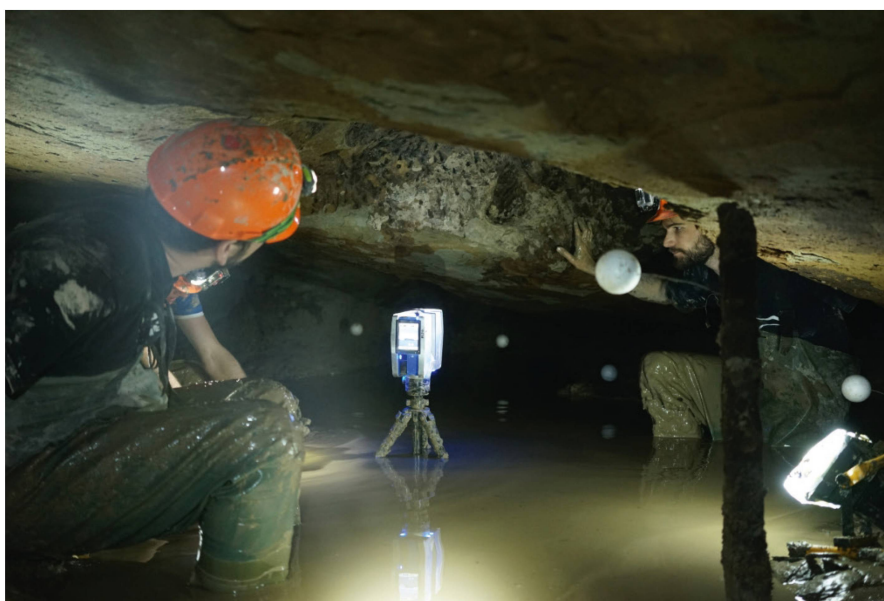
Abb. 1: Arbeiten im Meyerstollen unter massiv erschwerten Bedingungen.

Jede Gruppe, bestehend aus zwei bis drei Studierenden, erfasste die ihnen zugewiesenen Stollenteile abschnittsweise in einer Auflösung von 7 mm auf 10 m Aufnahmedistanz. Pro 360 Grad-Scan benötigte man mit diesen Einstellungen ca.