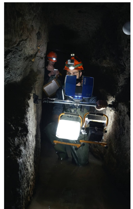
Abb. 3: Spannstativ mit aufgesetztem Scanner und Akkuscheinwerfer sowie mit Styroporkugeln signalisierte Verknüpfungspunkte.

Die Orientierung der Scans und damit verbunden die absolute Georeferenzierung (Lagerung) der 3D-Punktwolke erfolgte über die bereits im Stollen vorhandenen 3D-Fixpunktbolzen. Zusätzlich wurden sämtliche in den Scans sichtbaren Styroporkugeln detektiert oder manuell angemessen, um Zuverlässigkeit und Genauigkeit der Scanorientierungen zu steigern. So konnte schlussendlich eine dreidimensionale Gesamtgenauigkeit von wenigen Zentimetern erreicht werden. Nachdem sämtliche Scans geo-