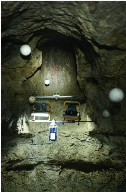
Abb. 2: Hängende Stationierung des Scanners mit Beleuchtung und Verknüpfungspunkten.

6 min. Um eine Abschattung der Ganganlagen durch die Operateure zu vermeiden, wurden einzelne Scans über die WiFi-basierte Fernsteuerung der Scanner ausgelöst.