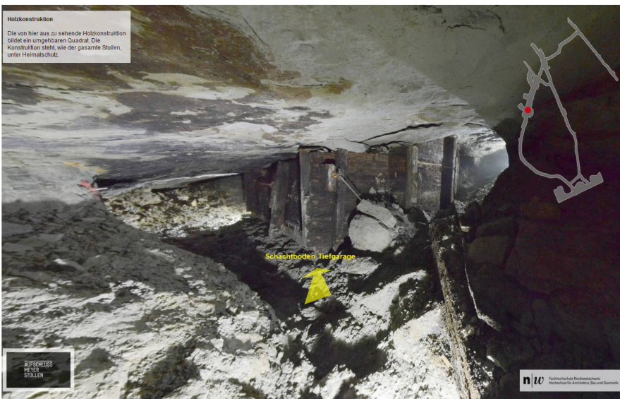
Abb. 5: Ansicht des Web-Panoramaviewers im nicht öffentlich zugänglichen Teil des Stollens.

Eine Teilgruppe beschäftigte sich mit der Auswertung von Spiegelreflexkameraaufnahmen, die am letzten Tag der Messkampagne mit einem Seitz Roundshot VR Drive Nodalpunktadapter ( www.roundshot.com ) durchgeführt wurden. Aus rund 80–100 Einzelbildern pro Standort mit einer Nikon D7000 wurden vollsphärische Panoramen prozessiert, welche in einen Panoramaviewer mit HTML/CSS und JavaScript implementiert wurden. In diesem Webviewer ist es möglich, den Stollen virtuell zu begehen und das Sichtfeld punktuell komplett frei zu bewegen (Abb. 5). Insgesamt wurden so 14 interessante Standorte im ganzen erfassten Bereich des Stollens abgelichtet. Da Besuchende des Museums nur einen sehr klei-