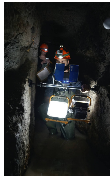
Abb. 3: Spannstativ mit aufgesetztem Scanner und Akkuscheinwerfer sowie mit Styroporkugeln signalisierte Verknüpfungspunkte.

Die Orientierung der Scans und damit verbunden die absolute Georeferenzierung (Lagerung) der 3D-Punktwolke erfolgte über die bereits im Stollen vorhandenen 3D-Fixpunktbolzen. Zusätzlich wurden sämtliche in den Scans sichtbaren Styroporkugeln detektiert oder manuell angemessen, um Zuverlässigkeit und Genauigkeit der Scanorientierungen zu steigern. So konnte schlussendlich eine dreidimensionale Gesamtgenauigkeit von wenigen Zentimetern erreicht werden. Nachdem sämtliche Scans geo-