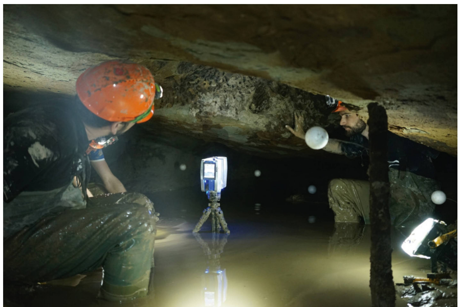
Abb. 1: Arbeiten im Meyerstollen unter massiv erschwerten Bedingungen.

Jede Gruppe, bestehend aus zwei bis drei Studierenden, erfasste die ihnen zugewiesenen Stollenteile abschnittsweise in einer Auflösung von 7 mm auf 10 m Aufnahmedistanz. Pro 360 Grad-Scan benötigte man mit diesen Einstellungen ca.