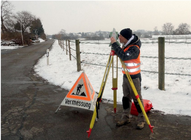
Die Mitarbeiter der Stadtvermessung Uster setzen auf eine zukunftssichere Lösung bei Berechnungssoftware, © P. Oberholzer.

Das Hochbau- und Vermessungsamt der Stadt Uster hat eine Systementscheidung getroffen und setzt seit Kurzem auf die Berechnungslösung von rmDATA.