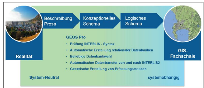
Abb. 2: Von der Realität zur GIS-Fachschale mit GEOS Pro.