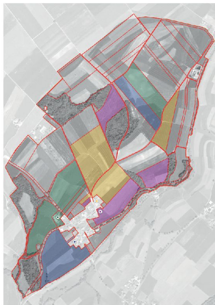
Fig. 8: Nouvel état de propriété à Engollon.