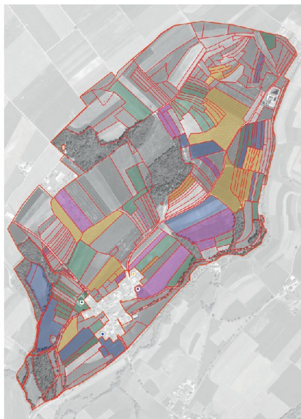
Fig. 7: Ancien état de propriété à Engollon.