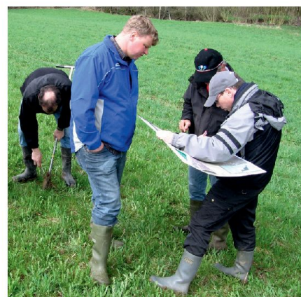
Fig. 4: Commission d'experts en pleine taxation des terres, 2008.

en prairie extensive permanente sont placées dans des secteurs en pente. Pour permettre aux collectivités publiques (canton et commune) de devenir propriétaires de l'entier des terrains touchés par les captages d'eau potable des Prés Royers, il a été procédé en cours d'opé-