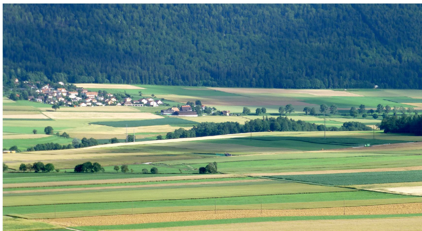
Fig. 3: Vue des SAF Engollon et La Côtière, 2013.

Bordant routes cantonales et ruisseaux traversant le périmètre, des talus abritent des populations de sangisorbes officielles et d'azurés des paluds, papillon emblématique de l'EcoRéseau Val-de-Ruz. Les syndicats se sont engagés pour leur maintien.