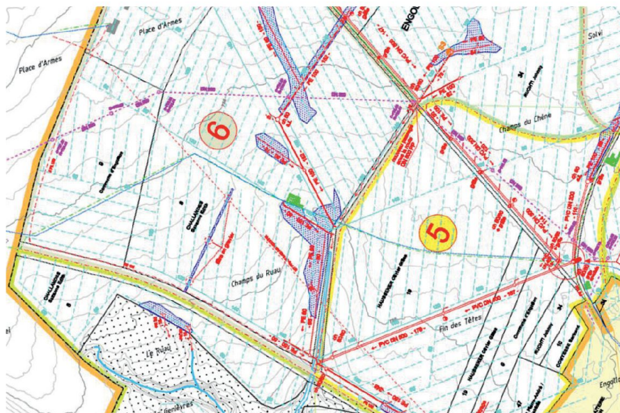
Fig. 2: Extrait du plan d'enquête des travaux de drainages et nouveaux collecteurs, SAF Engollon, 2013.

Les mesures de compensation obligatoires et volontaires des trois syndicats ont été placées aussi pour compléter le réseau initial. Des remises à ciel ouvert de collecteurs de drainages sont réalisées, des plantations de buissons et haies sont entreprises et des bandes anti-érosives