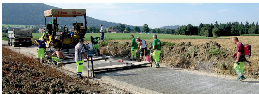
Fig. 6: Bétonnage d'un chemin à Engollon, 2012.