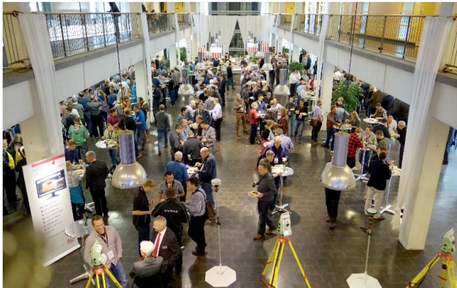
Die Ausstellung in der Haupthalle des Technoparks.

Zum 28. Mal fanden am 12. November 2014 im Technopark Zürich die traditionellen GEOMATIK-News statt. Dabei konnten gegen 400 Teilnehmer aus der Geomatik-Branche aus der Deutschschweiz und aus dem Tessin begrüsst werden!