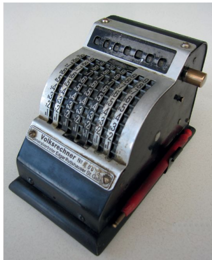
Abb. 3: Der Volksrechner mit Einstellwerk (unten) und Eingabestift sowie Ergebniswerk (oben) mit Löschkurbel (ohne Griff).

Spätere Modelle haben einen Hebel fürs Umschalten zwischen Addition und Subtraktion. In diesem Fall fehlt die zweite Ziffernreihe mit den Neunerkomplementen (Ergänzungszahlen). Zudem ist das Einstellwerk unten mit Sichtlöchern für die Eingabekontrolle ausgestattet. Neben dem Ergebniswerk weist auch das Einstellwerk eine Löschkurbel auf. Diese Geräte wurden von W. Häusler-Zepf, Olten (Marke Rapida 8, 1948), und Henri Zepf, Lausanne (Resulta BS) angeboten.