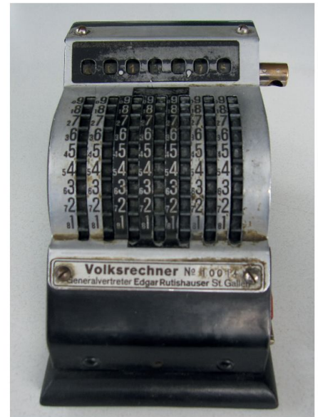
Abb. 1: Stellradgriffeladdierer mit Subtraktion und automatischem Zehnerübertrag namens «Volksrechner» aus St. Gallen bzw. Berlin aus den 1930er Jahren. Bei der Löschkurbel fehlt der Griff. Zu beachten: Die grossen Ziffern dienen für die Addition, die kleinen Ziffern (Komplementärwerte) für die Subtraktion (alle Bilder © Bruderer Informatik 2014).

Der 1901 geborene, in Amriswil TG heimatrechtigte Edgar Rutishauser war ein Erfinder. Die internationalen Patentdatenbanken listen für den Zeitraum 1939 bis 1964 (Anmeldung) elf Patente zu Vervielfältigungsmaschinen auf. 1930 war Rutishauser in St. Gallen (Murtortor, Postfach 654), wo er den Volksrechner für 95 Franken vertrieb, wie Anzeigen in der Neuen Zürcher Zeitung (2.4., 9.4., 25.6. und 2.7.1930) belegen. 1931 zog der Kaufmann nach Zürich, zunächst an die alte Beckenhofstrasse 59, später an die Tödistrasse 1. Das von ihm gegründete Unternehmen, die Schweizerische Spezialfabrik für Vervielfältigungsmaschinen (NZZ), war unter dem Firmennamen Edgar Rutishauser AG in Zürich von 1937 bis 1962/63 im Schweizerischen Regionen-