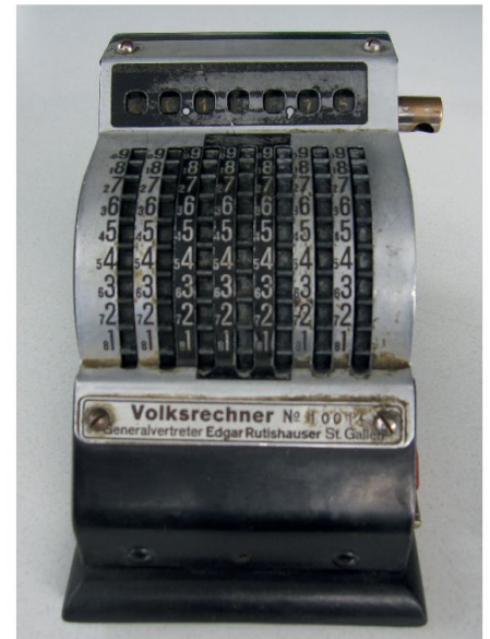
Abb. 1: Stellradgriffeladdierer mit Subtraktion und automatischem Zehnerübertrag namens «Volksrechner» aus St. Gallen bzw. Berlin aus den 1930er Jahren. Bei der Löschkurbel fehlt der Griff. Zu beachten: Die grossen Ziffern dienen für die Addition, die kleinen Ziffern (Komplementärwerte) für die Subtraktion.

Der 1901 geborene, in Amriswil TG heimatrechtigte Edgar Rutishauser war ein Erfinder. Die internationalen Patentdatenbanken listen für den Zeitraum 1939 bis 1964 (Anmeldung) elf Patente zu Vervielfältigungsmaschinen auf. 1930 war Rutishauser in St. Gallen (Murtortor, Postfach 654), wo er den Volksrechner für 95 Franken vertrieb, wie Anzeigen in der Neuen Zürcher Zeitung (2.4., 9.4., 25.6. und 2.7.1930) belegen. 1931 zog der Kaufmann nach Zürich, zunächst an die alte Beckenhofstrasse 59, später an die Tödistrasse 1. Das von ihm gegründete Unternehmen, die Schweizerische Spezialfabrik für Vervielfältigungsmaschinen (NZZ), war unter dem Firmennamen Edgar Rutishauser AG in Zürich von 1937 bis 1962/63 im Schweizerischen Regionen-