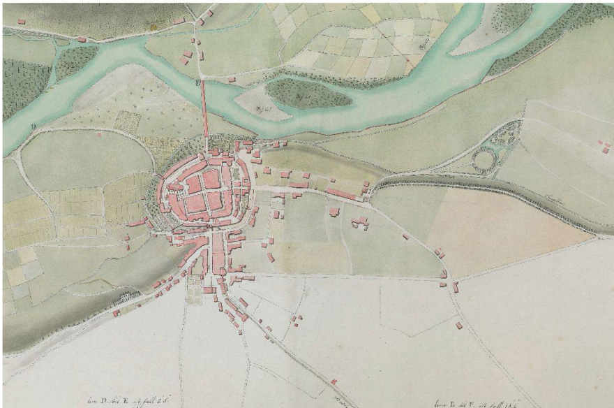
Abb. 1: Die vor 1728 erbaute Promenade Balänenweg bei Aarau startet in der Laurezenvorstadt und wurde entlang der Terrassenkante des Aaretals geführt. Ausserhalb des Siedlungsgebietes wurde eine Parkanlage oder Promenade (heute überbaut) und der Telliring (ein mit einer Promenade gefasster Turnplatz), beide 1804, angelegt. Ausschnitt aus dem Aareplan von 1809 (Aare von Gösgen bis Wildegg, Staatsarchiv Kanton Aargau, Sig.: CH-000051-7 P.10/0065/01).

1802 die Fäsenstaubpromenade 1804 2 (Abb. 2) gegenüber der Stadt und über dem Rhein auf der Terrassenkante erbaut. Bei Aarau wurde im Schachen 1804 eine Parkanlage oder Promenade erstellt (Abb. 1). 3 Die Schönheit der Natur wurde Ende des 18. und anfangs des 19. Jahrhunderts entdeckt.