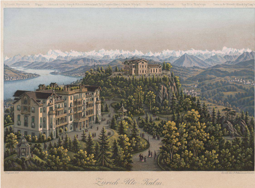
Abb. 3: Uetliberg mit Kulmhotel und Gartenanlagen in den Wäldern, zwischen 1879 und 1888

Infrastrukturen, die wir heute immer noch nutzen.