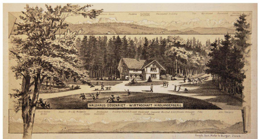
Abb. 4: Waldhaus Degenriet auf dem Umschlag des Plans Zürich-Aldisberg von 1888, herausgegeben vom Verschönerungs-Verein Zürich (Baugeschichtliches Archiv Zürich).

Es wurden in der zweiten Hälfte des 20. Jahrhunderts nur noch wenige Anlagen für die tägliche Erholungsnutzung ausserhalb des Siedlungsgebietes erstellt. Sehr viele Aussichten verschwanden durch fehlenden Unterhalt von bestock-