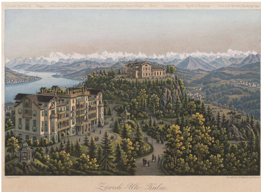
Abb. 3: Uetliberg mit Kulmhotel und Gartenanlagen in den Wäldern, zwischen 1879 und 1888

Infrastrukturen, die wir heute immer noch nutzen.