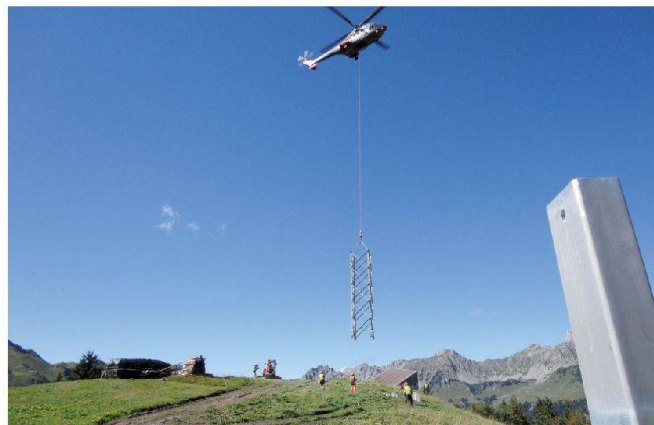
Fig. 4: Grand Clé – transport d'un élément du pylône P3.

quant à lui, ne répondait plus aux exigences d'une agriculture de montagne moderne.