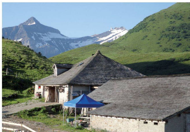
Fig. 2: Alpage de Grand Clé.