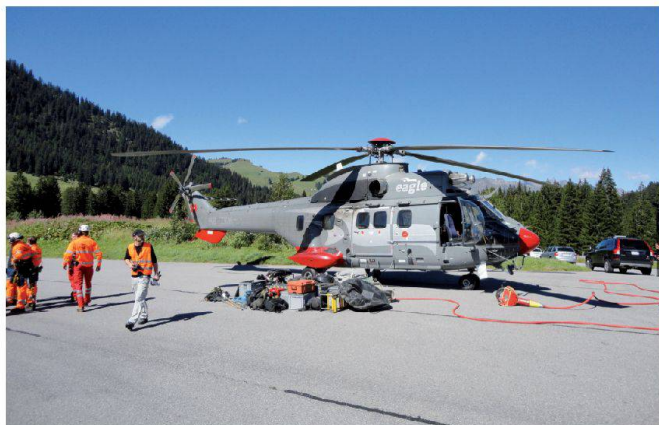
Fig. 3: Hélicoptère Super Puma.