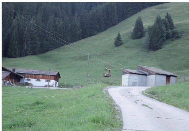
Fig. 1: Jable – ancienne installation.

Cette ancienne tradition de fabrication avait déjà nécessité la construction de plusieurs téléphériques d'alpage au début des années 1970 pour faciliter le transport du matériel, du fromage, ainsi que les déplacements des amodiateurs et leurs familles pour permettre l'exploitation et l'entretien de pâturages situés entre 1300 et 2000 m d'altitude. Après une trentaine d'années de bons services, ces installations ont commencé à montrer des signes de fatigue. Leur vérification et leur mise aux normes de sécurité étaient devenues de plus en plus compliquées. Le standard technique de ces installations,