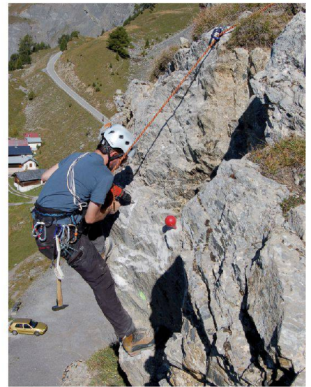
Abb. 1: Vermarkung einer Rückversicherung im rohen Fels.

Alternative Messmethoden wie die Satellitenmesstechnik (Global Navigation Satellite System GNSS) ermöglichen es nun, die Hebungsraten in einem Testgebiet abseits der Linien des Landesnivellements zu untersuchen. Ideal dafür ist ein Testgebiet, in welchem bei den bisherigen Untersuchungen möglichst grosse Höhenänderungen festgestellt wurden. Des Weiteren ist es wichtig, dass die ursprünglich verwendeten Fixpunkte noch vorhanden