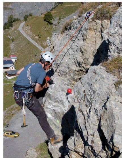
Abb. 1: Vermarkung einer Rückversicherung im rohen Fels.

Alternative Messmethoden wie die Satellitenmesstechnik (Global Navigation Satellite System GNSS) ermöglichen es nun, die Hebungsraten in einem Testgebiet abseits der Linien des Landesnivellements zu untersuchen. Ideal dafür ist ein Testgebiet, in welchem bei den bisherigen Untersuchungen möglichst grosse Höhenänderungen festgestellt wurden. Des Weiteren ist es wichtig, dass die ursprünglich verwendeten Fixpunkte noch vorhanden