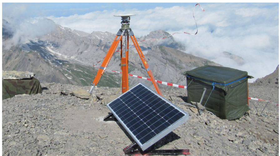
Abb. 3: Solarpanel nahe dem Arpelistockgipfel.

Während vier Wochen wurden im gesamten Netz langstatische, gleichzeitige GNSS-Messungen (48h-Sessionen) durchgeführt. Dabei wurde strikt darauf geachtet, dass die Auswertung von kur-