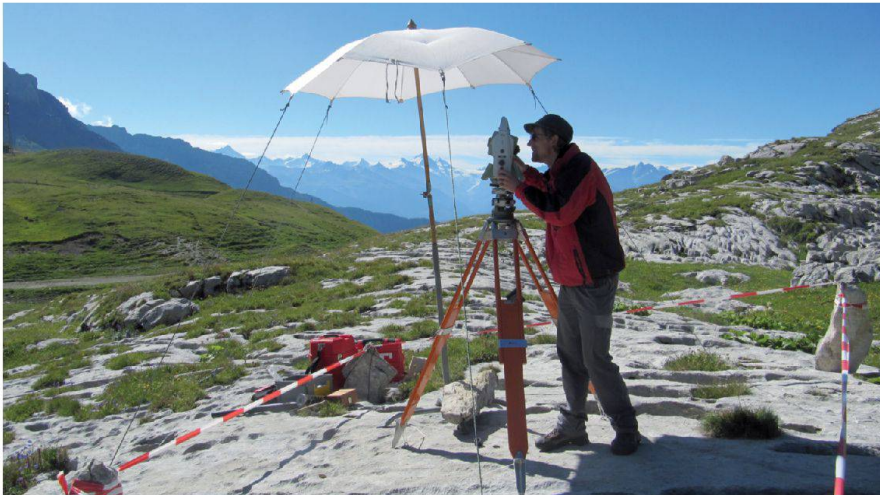
Abb. 4: Einmessung der Rückversicherungen nahe dem Sanetschpass.

zen Basislinien (kürzer als 10 km) möglich war. Das Netz wurde zweimal mit zwei unabhängigen Instrumentenflotten gemessen: GNSS-Flotte der FHNW und GPS-Flotte von swisstopo. Insgesamt waren 13 GNSS-Empfänger im Einsatz, welche 1604 h Messdaten oder 2 401 797 GNSS-Positionen aufzeichneten (ohne Permanentstationen). Als Referenz für sämtliche GNSS-Messungen diente das Automatische GNSS Netz Schweiz AGNES von swisstopo [3]. Zudem wurden Messungen der permanenten GNSS-Stationen der Forschungsprojekte TECVAL und COGEAR der Eidgenössischen Technischen Hochschule Zürich mitausgewertet (vgl. Abb. 2).