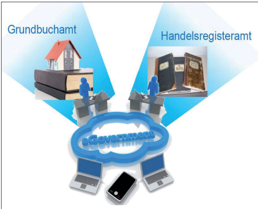
Abb. 1: E-Government in der Justiz-, Gemeinde- und Kirchendirektion des Kantons Bern.

käufer zum Notar – nennen wir ihn Notar Siegel. Für die Errichtung seiner Urkunde benötigt Notar Siegel nebst den Personalien der Vertragsparteien eine Vielzahl von Informationen aus dem Grundbuch. Im besten Fall kann Notar Siegel die für seine Urkunde notwendigen Angaben aus dem Grundbuch elektronisch abfragen und in die Urkunde kopieren. Wenn nicht, bleibt ihm nichts anderes übrig, als alles abzutippen. Reicht der Notar seine Urkunde schliesslich beim zuständigen Grundbuchamt zur Anmeldung im Grundbuch ein, muss dieses wiederum die meisten Daten aus der Urkunde im elektronischen Grundbuch eingeben. Oder etwas salopp ausgedrückt werden heute für die Abwicklung von Grundbuchgeschäften eine Vielzahl von Informationen in ein elektronisches System getippt und auf Papier ausgedruckt, nur damit dieselben Informationen beim nächsten Verarbeitungsschritt wiederum in ein elektronisches System eingegeben werden müssen. Das kann doch nicht mehr zeitgemäss sein!