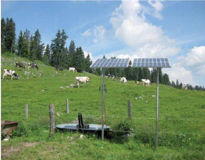
Fig. 8: Panneaux solaires activant une pompe immergée.