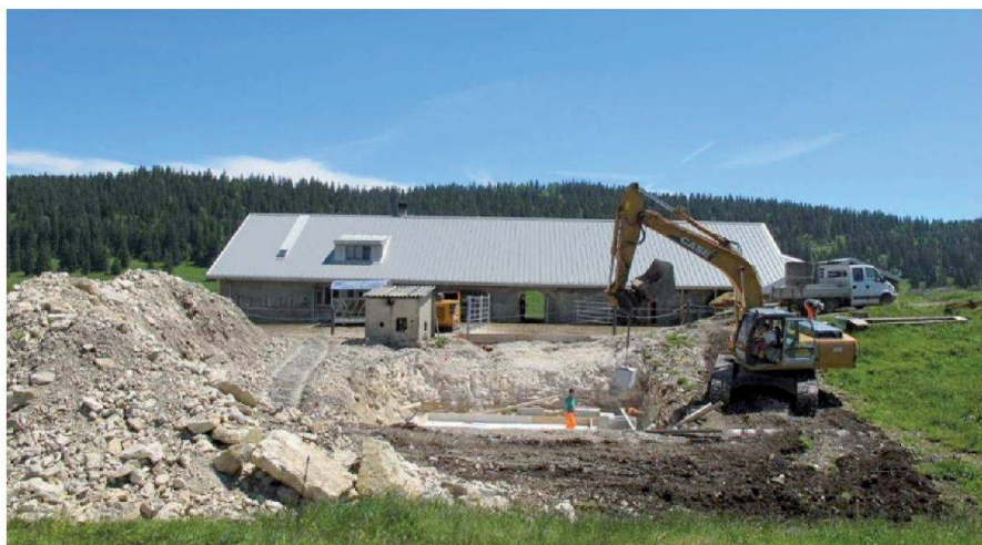
Fig. 3: Réfection d'un chalet: toiture, logement, fromagerie, local d'accueil du public, salle de traite et fosse à purin.