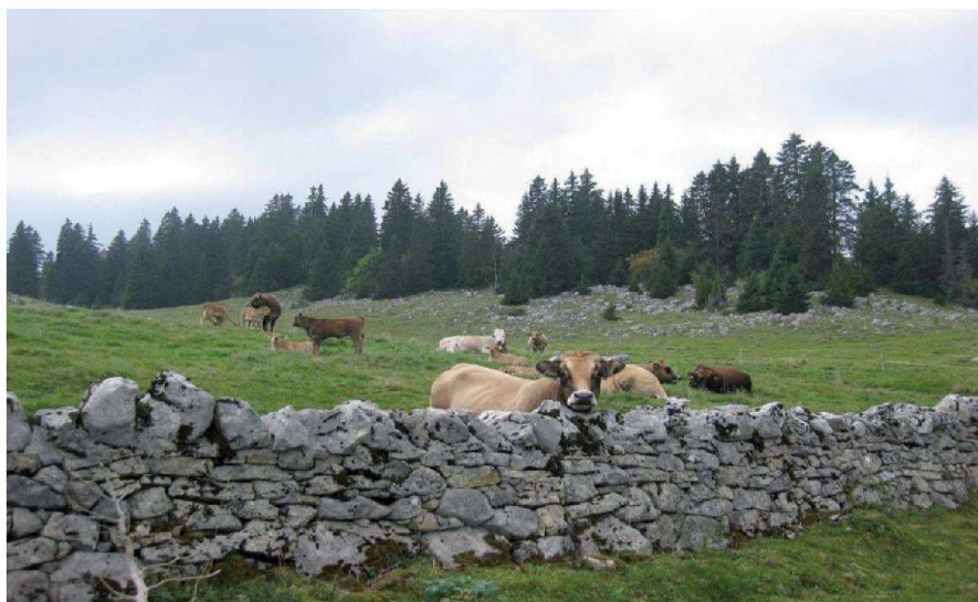
Fig. 1: Boisés, herbages, bétail et mur en pierres sèches sont les caractéristiques principales des alpages jurassiens.