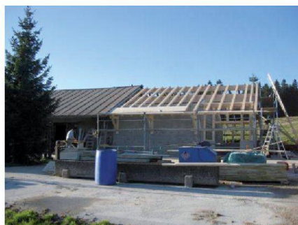
Fig. 5: Construction d'une nouvelle fromagerie d'alpage.

météoriques est également prioritaire. Le respect des particularités architecturales des bâtiments permet de conserver leur typicité.