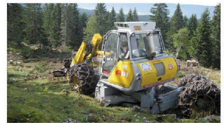
Fig. 12: Nettoyage des branches après une coupe sur pâturage.

La plupart des projets d'aménagement bénéficie de contributions publiques. Les autorités qui allouent des fonds publics