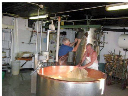
Fig. 4: Fromagerie d'alpage.