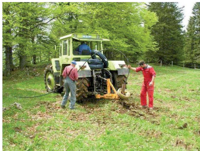
Fig. 7: Pose de conduites à la soussoleuse.