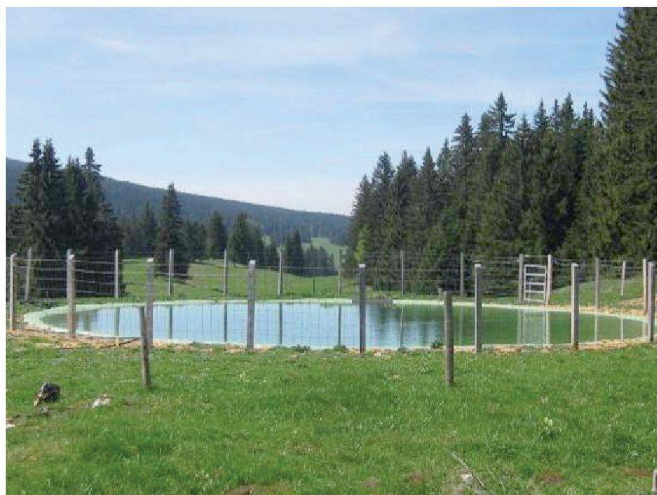
Fig. 6: Etang bâché de 270 m³.

La gestion des herbages et des boisés occupe une place importante dans un PGI. Une carte de végétation permet de calculer le potentiel fourrager et le volume de bois sur pied. La pérennité des rendements en herbe et en bois dépend du sys-