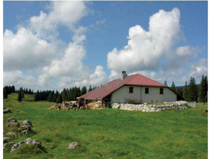
Fig. 9: Citerne alimentée par une toiture.