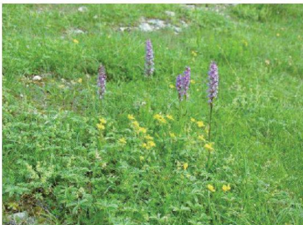
Fig. 11: Pâturage sec riche en orchidées.

tème de pâture et de la maîtrise du rajeunissement du bois et des coupes régulières.