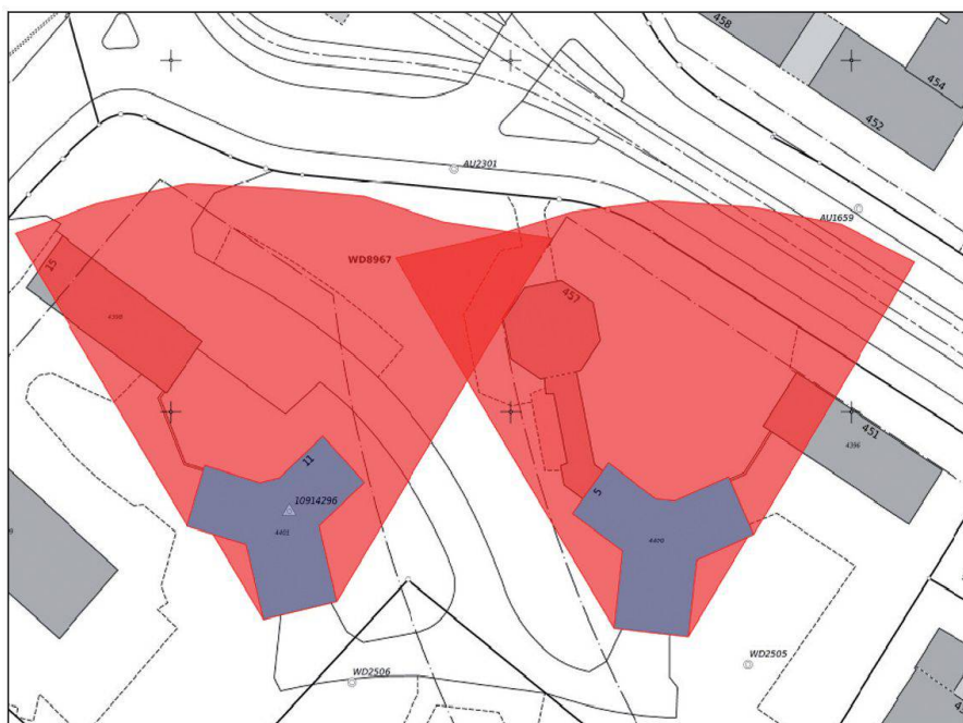
Abb. 1: Beispiel eines Zweistundenschattens zweier Hochhäuser.

Die Abteilung «Bauvermessung» (BV) begleitet schwergewichtig Bauvorhaben im Gebiet der Stadt und zwar in enger Kooperation mit dem Amt für Baubewilligungen. Sie dient im dicht bebauten Umfeld der Stadt Zürich mit hohen Bodenwerten und Raumknappheit vor allem der Qualitätssicherung bei der Bauprojektierung und -ausführung. Sie unterstützt den Prozess der Bauvorhaben bei der präzisen Projektierung sowie bei der Kontrolle der Bauausführung. Neben dieser als «amtliche Bauvermessung» bezeichneten Tätigkeit ist die Bauvermessung mit ihren rund 20 Mitarbeiterinnen und Mitarbeiter zuständig für die Ingenieurvermessung (Nivellements, Laserscanning, Überwachungsvermessungen, Deformationsvermessungen etc.), die thematische Vermessung (Höhenaufnahmen, Höhenkurvenpläne) und verschiedene Bereiche der Spezialvermessung (z.B. Kanalvermessung). Beide Abteilungen der Stadtvermessung, die Abteilung AV wie BV leisten einen wichtigen Beitrag für das Bauwesen in der Stadt Zürich.