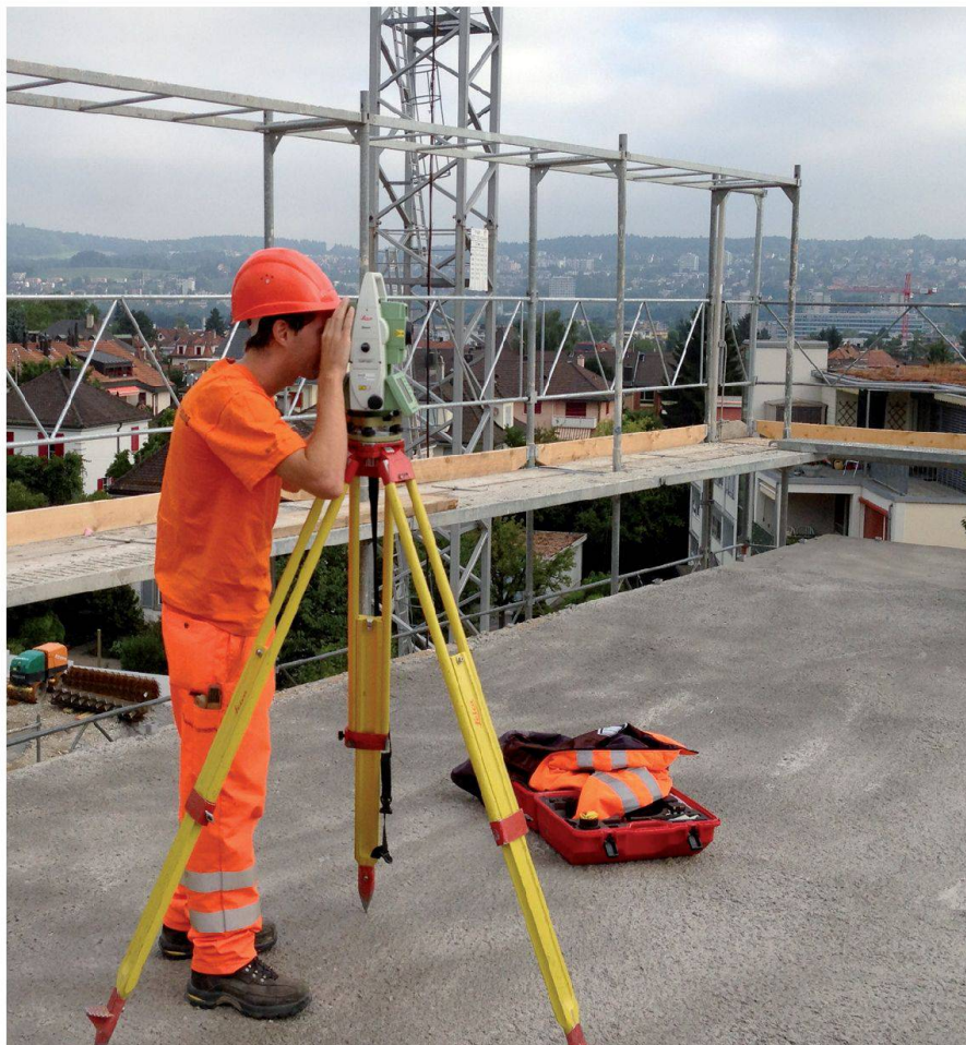
Abb. 3: Ein Mitarbeiter von Geomatik + Vermessung bei der Bauvermessung. Fig. 3: Un collaborateur de Géomatique + Mensuration lors de mesures d'une construction.