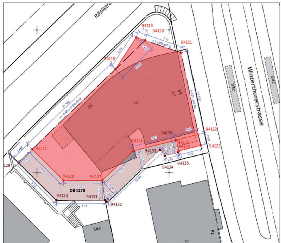
Abb. 2: Beispiel für eine Baumassberechnung.

Mit der Einführung des ÖREB-Katasters in der Stadt Zürich (Anfang 2014) können viele Grundlagen zur Berechnung des Baumasses direkt aus den ÖREB-Daten abgeleitet werden, womit die Baumassberechnung eine zusätzliche rechtliche Qualität erfährt.