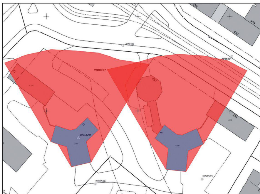
Abb. 1: Beispiel eines Zweistundenschattens zweier Hochhäuser.

Die Abteilung «Bauvermessung» (BV) begleitet schwergeköchtet Bauvorhaben im Gebiet der Stadt und zwar in enger Kooperation mit dem Amt für Baubewilligungen. Sie dient im dicht bebauten Umfeld der Stadt Zürich mit hohen Bodenwerten und Raumknappheit vor allem der Qualitätssicherung bei der Bauprojektierung und -ausführung. Sie unterstützt den Prozess der Bauvorhaben bei der präzisen Projektierung sowie bei der Kontrolle der Bauausführung. Neben dieser als «amtliche Bauvermessung» bezeichneten Tätigkeit ist die Bauvermessung mit ihren rund 20 Mitarbeiterinnen und Mitarbeiter zuständig für die Ingenieurvermessung (Nivellements, Laserscanning, Überwachungsvermessungen, Deformationsvermessungen etc.), die thematische Vermessung (Höhenaufnahmen, Höhenkurvenpläne) und verschiedene Bereiche der Spezialvermessung (z.B. Kanalvermessung). Beide Abteilungen der Stadtvermessung, die Abteilung AV wie BV leisten einen wichtigen Beitrag für das Bauwesen in der Stadt Zürich.