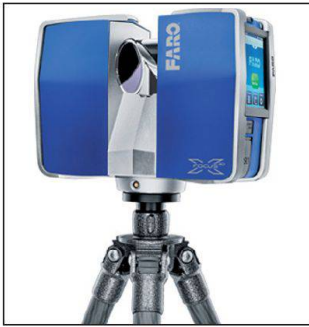
FARO Focus3D X 330 Laser Scanner.

Der neue Focus3D X 330 besticht durch Funktionalität und Leistung. Mit einer fast dreimal so grossen Reichweite wie sein Vorgänger kann der Focus3D X 330 nun Objekte bei vollem Sonnenlicht scannen, die bis zu 330 m weit entfernt sind. Dank seines integrierten GPS-Empfängers kann der Laserscanner in der Nachbearbeitung die Einzelscans noch schneller registrieren und zu einer hochgenauen Punktwolke zusammenführen. Dies macht den Focus3D X 330 zum idealen Instrument für Vermessungsanwendungen.