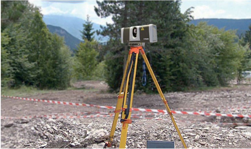
Abb. 2: Scannen für das 3D-Modell.

richteten wir mit einem Trimble R8 GNSS-System über das gesamte Areal hinweg eine gewisse Anzahl georeferenzierter Festpunkte ein. Anschliessend legten wir mit Hilfe einer Totalstation ein Netz aus Punkten mit bekannten Koordinaten an, die als Standpunkte zum Scannen dienen sollten. Nachdem dies abgeschlossen war, konnten wir den Trimble FX™ 3D-Scanner aufbauen und mit der eigentlichen Arbeit beginnen. Schon aus den ersten 3D-Messungen liess sich auf eine herausragende Qualität schliessen. Und tatsächlich waren wir von der hohen Auflösung und der Millimetergenauigkeit der Punktwolken-Rohdaten sehr beeindruckt.»