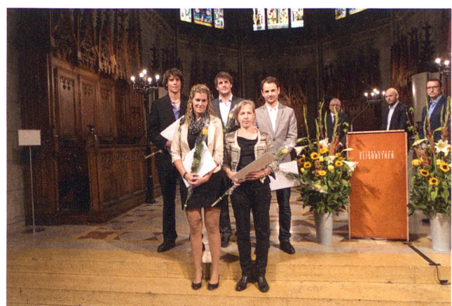
Frischgebackene Master of Science in Engineering der HABG.