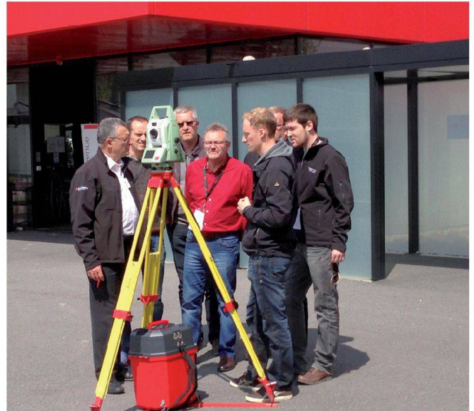
La nouvelle MultiStation MS50 en action.

Leica Geosystems SA Rue de Lausanne 60 CH-1020 Renens Téléphone 021 633 07 20 Téléfax 021 633 07 21 info.swiss@leica-geosystems.com www.leica-geosystems.ch