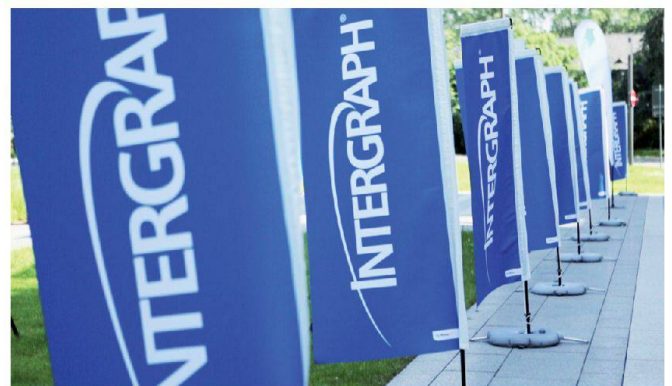
Intergraph-Flaggen-See vor der Rhein-Mosel-Halle, Koblenz.

Innovationen, zur Marktlage und Unternehmenspolitik von Intergraph. Bestehende Produkte und Lösungen, konkrete Anforderungen an die zukünftige Softwareentwicklung und aktuelle Problemstellungen werden hingegen in so genannten Nutzergruppen diskutiert. So richtet sich die vor wenigen Monaten gegründete G!NIUS-Nutzergruppe an Anwender der Softwarelösung G!NIUS von Intergraph, speziell bei Ver- und Entsorgungsunternehmen. Auf dem Intergraph-Forum 2013 wurde die G!NIUS-Nutzergruppe erstmals dem breiten Auditorium vorgestellt.