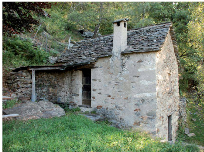
Fig. 3 e 4: Esempi di edifici meritevoli di conservazione (rustici).

L'approvazione quasi all'unanimità del PUC-PEIP ( www.ti.ch/puc-peip ) da parte del Gran Consiglio, avvenuta l'11 maggio 2010, avrebbe dovuto costituire per così dire l'atto risolutivo della complessa questione legata alla gestione dei rustici, ma purtroppo non è stato il caso. Il ricorso presentato dall'Ufficio federale dello sviluppo territoriale (ARE) ha infatti imposto un'ulteriore negoziazione. Il ricorso concerne in particolare due aspetti: