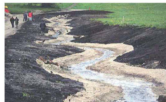
Abb. 7: Limpach im Thuner Westamt, 2004. Künftig dürfte dieser Gewässerraum aufgrund des revidierten GSchG bereits zu wenig breit sein.

Auffallend dabei: Mit der Einführung der EDV hat neben der Papierflut die Zahl der Mitberichte und Stellungnahmen inflationär zugenommen. Was einst bei grossen Projekten durchaus angemessen war, der Einbezug verschiedenster Interessen und Meinungen und deren Abwägung, wird heute fast bei jedem noch so kleinen Projekt geradezu zelebriert. Ich meine dabei nicht nur jene, welche sich zu unse-