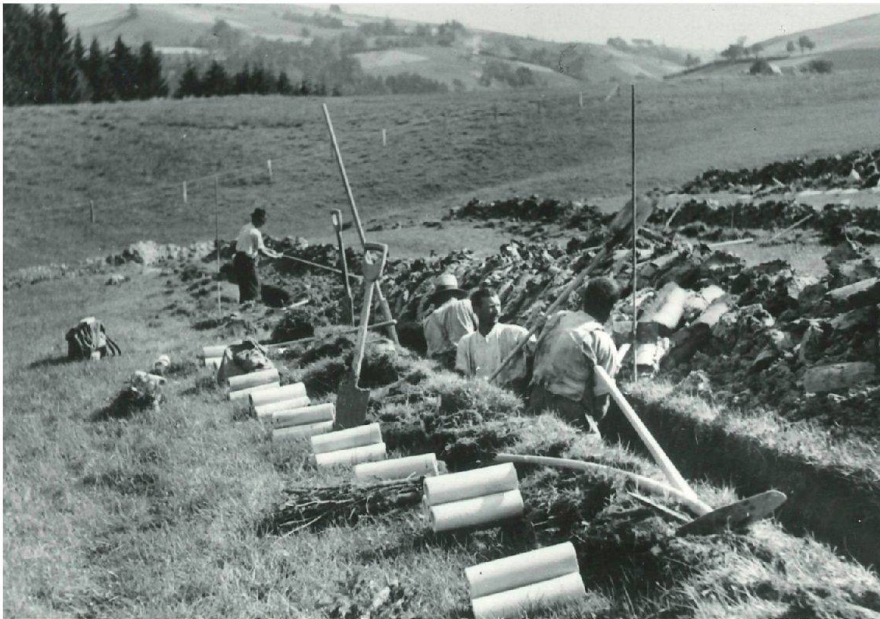
Abb. 2: Rüeggisberg 1944. Aushub der Drainagegräben von Hand 2 .

den war der Bau von einfachen Feldwegen und von Entwässerungen.