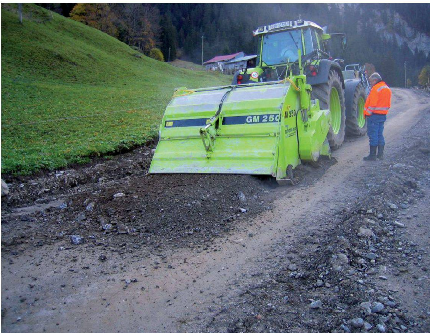
Abb. 9: Mobiler Brecher. Weg Wintergüetli, Gsteig, fahrbarer Brecher mit Mischgerät zur Hydrophobierung, 2004.

Ich danke all meinen Vorgesetzten, meinen Kolleginnen und Kollegen von in- und ausserhalb der Verwaltung. Ihr habt wesentlich dazu beigetragen, dass ich mit gutem Gefühl und positivem Blick Vor- und Rückschau halten kann.