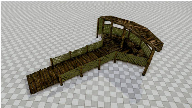
Abb. 5: 3D-Modell der Vogelbeobachtungsplattform.