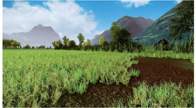
Abb. 2: Fettwiese und Hochhecke im Hintergrund vor Projektausführung.