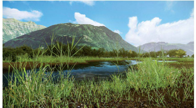
Abb. 4: Flachwasserzone nach Projektausführung.