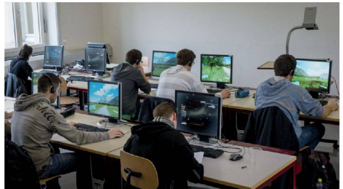
Abb. 6: Testpersonen beim Experiment.

gesetzt werden und ermöglichen nahezu fotorealistische Darstellungen, in denen die Anwender die Landschaft in Echtzeit erkunden können.