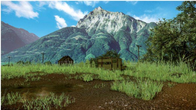
Abb. 3: Vogelbeobachtungsplattform und Tümpel nach Projektausführung.