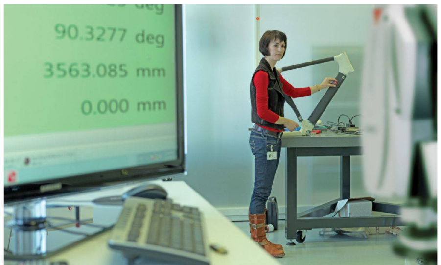
Abb. 1: Tracker Pilot DRO (Data Read Out) bei der Messung mit 1.5" RRR (Red-Ring Reflector) und Leica Absolute Tracker AT401.

Eine Prämisse der Tracker Pilot Softwareentwicklung ist die Gewährleistung der Benutzerfreundlichkeit und damit der einfachen Bedienung.