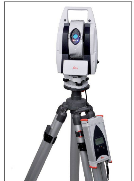
Abb. 2: Leica Absolute Tracker AT401 mit Controller und Stativ.

Jede Qualitätsprüfung ist nur so gut wie das verwendete Prüfverfahren. Es ist daher wichtig, die Prüfmittel regelmässig zu kontrollieren und wenn nötig zu justieren. Zu diesem Zweck wurde der Tracker Pilot entwickelt. Es handelt sich dabei um ein Programm, welches auf dem Applikationsrechner des AT401 Nutzers installiert wird. Er stellt eine Reihe von geführten Prozessen zur Verfügung, um die erreichbare Genauigkeit vor einer Messaufgabe zu ermitteln. Gleichzeitig kann der AT401