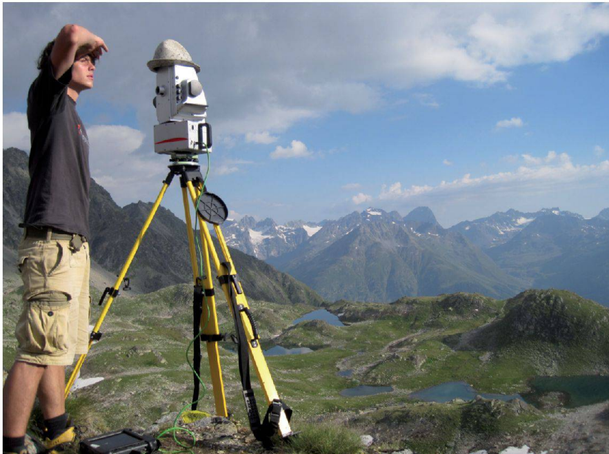
Abb. 3: Ich bei Umgebungsbeobachtungen für die Bewegungsmessungen am Blockgletscher Macun (Bachelorthesis).

fungsrichtung Geoinformationstechnologie am Institut für Vermessung und Geoinformation zu absolvieren. Neben Vertiefungen in der Geoinformatik und Photogrammetrie bietet dieser Studiengang auch die Grundlage für das Geometerpatent. Ehemalige Studenten berichteten, dass im MSE wichtige soziale Netzwerke aufgebaut werden können und wichtige Grundkenntnisse in der Unternehmungsführung erlernt werden. Ich komme also meinem Berufsziel, dem Geometerpatent, ein Stück näher. Zudem werden mir die Chancen geboten, mein erlerntes Fachwissen in interessanten, internationalen Projekten unter Beweis zu stellen. Nach kurzer Erholung ist die Spannung auf den ersten Schultag als Masterstudent gross. Ich freute mich besonders auf den individuell nach meinen Interessensrichtungen zusammengestellten Stundenplans. Bei der Wahl der Module hatte ich darauf geachtet, dass die Module Grundlagen für die Unternehmens-