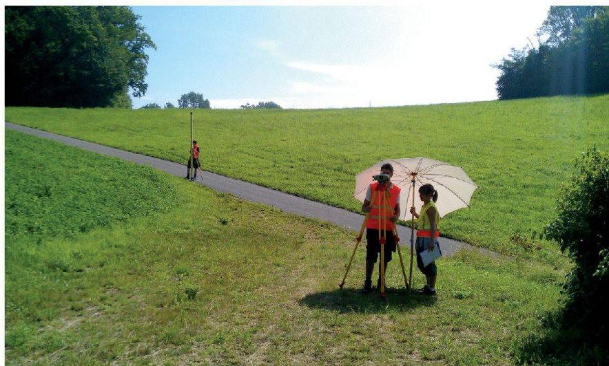
Abb. 1: Meine Messgruppe am Nivellieren während des Blockkurses auf dem Wartenberg.

male Studienalltag einpendelte. Am Morgen noch mit verklebten Augen und Augenringen mit dem Tram von Basel, meiner neuen Heimat, nach Muttenz, wo uns die Lehrkräfte mit Wissen überschütten. Am Abend, zuhause, sollte repetiert und gelernt werden. Natürlich war dies selten der Fall, denn schliesslich sind wir hier in Basel. Und hier gibt es genügend Einklehrmöglichkeiten, um am Abend auch «einmal» mit Studienkollegen bei einem Bier zusammensitzten. Dies ist doch wesentlich interessanter als zu Lernen, oder? Basel ist übrigens eine super Stadt für Landeier wie mich. Denn die Grösse ist überschaubar und es gibt einen direkten Zug in meine geliebten Berge. Zu Beginn des Studiums reiste ich öfters mal nach Hause. Irgendwie vermisste ich die frische Bergluft, die Ruhe dort oben und natürlich meine Geissen. Doch je weiter das Studium fortschritt, desto mehr Kontakte knüpfte ich hier und desto mehr reizte es mich, viel Zeit hier zu verbringen. Die anfängliche Nervosität kehrte dann jedoch Mitte Januar zurück. Die ersten Modulabschlussprüfungen standen vor der Tür. Die Spannung im Klassenraum war richtiggehend fassbar. Die Sorgenkinder hiessen: Analysis, Geoinformatik und Geodätische Messtechnik. Nach dieser schweren Last folgten diverse Blockkurse. Und danach hatten wir endlich mal Ferien! Wobei... Stopp! Das heisst hier