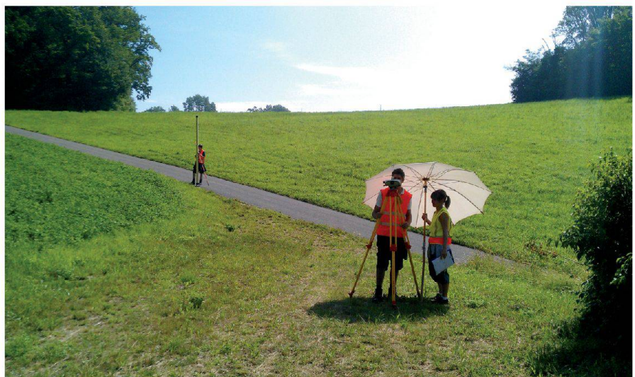
Abb. 1: Meine Messgruppe am Nivellieren während des Blockkurses auf dem Wartenberg.

male Studienalltag einpendelte. Am Morgen noch mit verklebten Augen und Augenringen mit dem Tram von Basel, meiner neuen Heimat, nach Muttenz, wo uns die Lehrkräfte mit Wissen überschütten. Am Abend, zuhause, sollte repetiert und gelernt werden. Natürlich war dies selten der Fall, denn schliesslich sind wir hier in Basel. Und hier gibt es genügend Einkerzmöglichkeiten, um am Abend auch «einmal» mit Studienkollegen bei einem Bier zusammensitzend. Dies ist doch wesentlich interessanter als zu Lernen, oder? Basel ist übrigens eine super Stadt für Landeier wie mich. Denn die Grösse ist überschaubar und es gibt einen direkten Zug in meine geliebten Berge. Zu Beginn des Studiums reiste ich öfters mal nach Hause. Irgendwie vermisste ich die frische Bergluft, die Ruhe dort oben und natürlich meine Geissen. Doch je weiter das Studium fortschritt, desto mehr Kontakte knüpfte ich hier und desto mehr reizte es mich, viel Zeit hier zu verbringen. Die anfängliche Nervosität kehrte dann jedoch Mitte Januar zurück. Die ersten Modulabschlussprüfungen standen vor der Tür. Die Spannung im Klassenraum war richtiggehend fassbar. Die Sorgenkinder hiessen: Analysis, Geoinformatik und Geodätische Messtechnik. Nach dieser schweren Last folgten diverse Blockkurse. Und danach hatten wir endlich mal Ferien! Wobei... Stopp! Das heisst hier