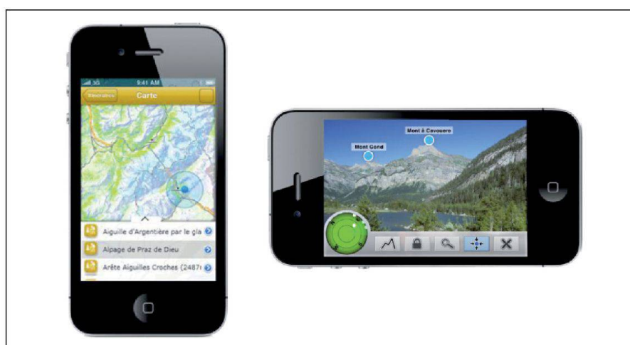
Fig. 2: Application iPhone.