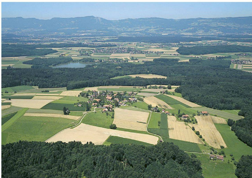
Abb. 1: Steinhof, Ortsteil der Gemeinde Aeschi (SO).

Die Solothurner Gemeinde Steinhof im Bezirk Wasseramt ist vollständig vom Kanton Bern umschlossen. Sie umfasst 163 ha; davon 48 ha Wald. In Steinhof wohnen 150 Personen. Drei Familienbetriebe bewirtschaften 77 ha landwirtschaftliche Nutzfläche und halten 115 Grossvieheinheiten. Nebst Ackerbau und Rindviehmast werden jährlich 400 000 kg Milch produziert. Am 1. Januar 2012 hat die Gemeinde Steinhof mit der nächstgelegenen Solothurner Gemeinde Aeschi fusioniert. Fast alle Wasserämter-Gemeinden haben mit Güterregulierungen (Meliorationen) umfangreiche Entwässerungsanlagen gebaut. Einige haben mit der «Bahn 2000»