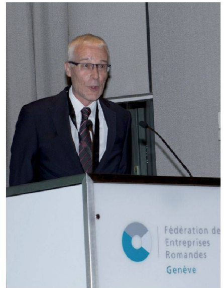
Fig. 2: M. René Leutwyler, Ingénieur cantonal du Canton de Genève.

Les participants à l'assemblée, ainsi que les invités, se sont vus remettre un pin's de l'IGS qu'ils pourront désormais porter en tant que signe distinctif. L'assemblée générale a également traité la problématique des conséquences du droit international sur la mensuration officielle, en particulier la reconnaissance d'un candidat étranger en tant que