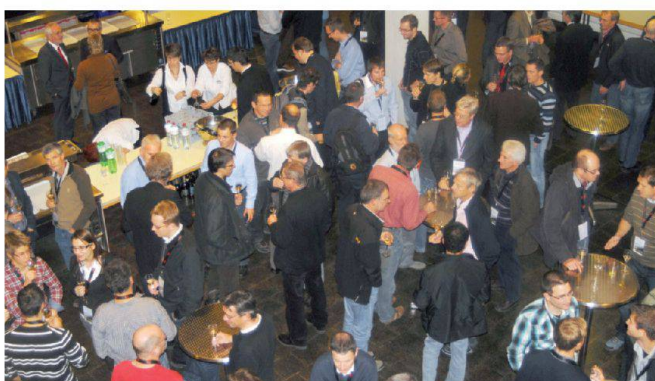
Anstossen auf die 25. GEOMATIK-News.