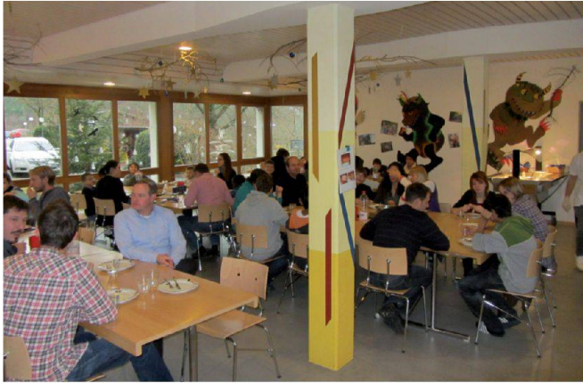
Erlebnisaustausch nach dem Mittagessen.

Auch Ende 2011 unterstützte die Asseco BERIT AG mit einer weihnachtlichen Spende die Schülerinnen und Schüler des Schulheims Sommerau.