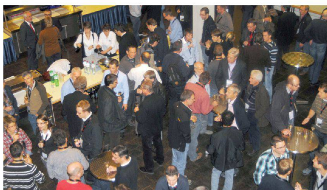
Anstossen auf die 25. GEOMATIK-News.