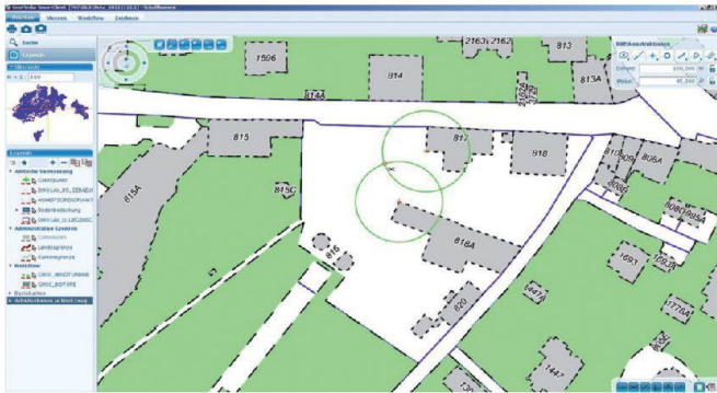
Benutzeroberfläche von GeoMedia Smart Client mit Punkt-Fangfunktionen (Snapping) und Konstruktionshilfen.