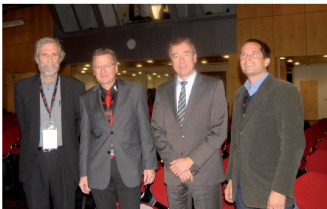
Einige Fachreferenten mit Moderator.