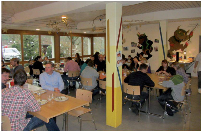
Erlebnisaustausch nach dem Mittagessen.

Auch Ende 2011 unterstützte die Asseco BERIT AG mit einer weihnachtlichen Spende die Schülerinnen und Schüler des Schulheims Sommerau.