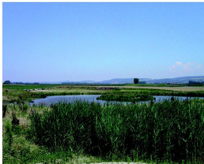
Fig. 3: Pré Bovet: état 2011.

L'important réseau de collecteurs de drainages existant ne devait pas être augmenté afin d'éviter des apports supplémentaires dans la Petite Glâne. Aucun nouveau collecteur n'a été construit, mais les existants ont été réparés sur des longueurs totalisant 21 km.