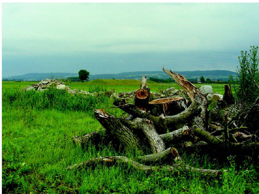
Fig. 4: Pré Bovet: microstructure (branches).

Les objectifs poursuivis par le réseau sont ambitieux. Il s'agit d'atteindre une proportion de 10% de SCE distantes de