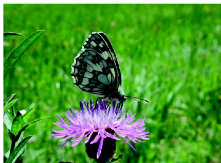
Fig. 5: Demi-deuil.

Le nouvel état de propriété était déjà en place lors de l'entrée en vigueur de l'OQE. Si au départ ce sont le subventionnement supplémentaire et les paiements directs complémentaires qui ont incité les membres du Syndicat à initier un projet de réseau OQE, ils se sont très vite pris au jeu et ont incité leurs collègues à en faire autant. Ainsi, en 2011, 29 agriculteurs participaient au réseau. En cinq ans, la proportion de SCE correspondant aux critères du réseau est passée de 6,6% à 11% du périmètre. Cette augmentation est due à la plantation de cinq haies et de plus de 600 arbres. Les plantations de haies ont été effectuées par des bénévoles et des écoliers.