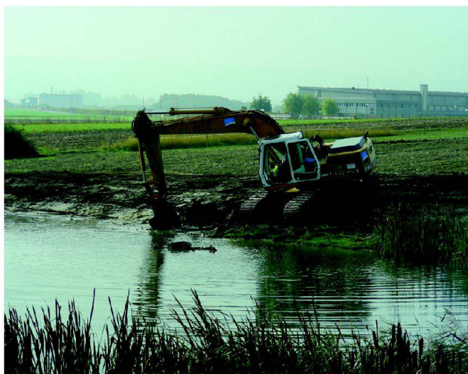
Fig. 2: Pré Bovet: terrassement 2004.