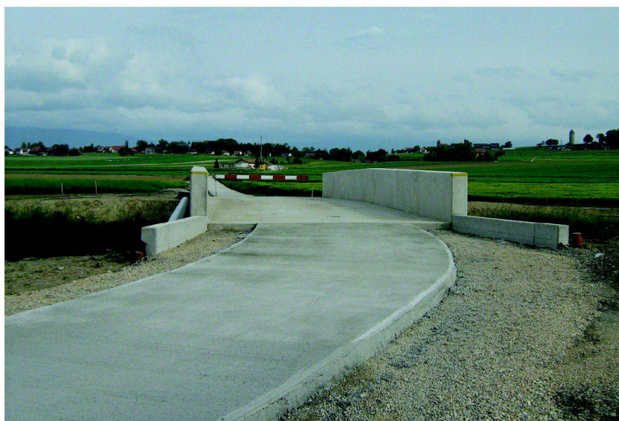
Fig. 1: Pont sur la Petite Glâne.

Le réseau de chemins est de 9,5 km de chemins bétonnés, 11,4 km de chemins gravier-stabilisé et 6,2 km de chemins herbés.