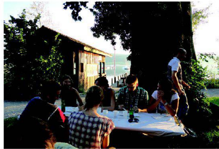
Abb. 2: Impression vom Grillfest am Greifensee.

Wettingen, um dort die LägereBräu zu besichtigen. Im Herbst finden eine Besichtigung der Wasserversorgung Zürich und ein Fach-