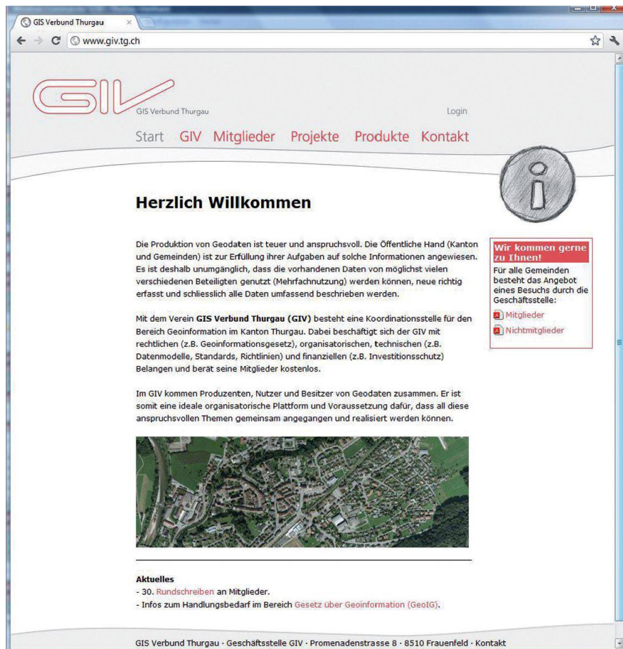
Abb. 2: Die Website des GIV wird rege als Informationskanal zu den Mitgliedern genutzt.

Ziele des GIV und des Kantons als Mitglied sind, dass die über etliche Jahre erarbeiteten Produkte und Dienstleistungen des Vereins (Normen, Standards, Datenmodelle, Arbeitsunterlagen, Checkertools, Veranstaltungen, Beratungen, usw.), die durch die Mitglieder (verschiedenste kantonale Stellen, Gemeinden, Ver-/Entsorger, unterschiedliche Ingenieurfachbereiche) im beruflichen Alltag täglich genutzt werden, wie bis anhin auch in Zukunft durch den Verein fachgerecht und zuverlässig produziert und auch ständig nachgeführt werden. So widmet sich der GIV aktuell der Überar-