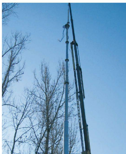
Fig. 7: Installation pompe.