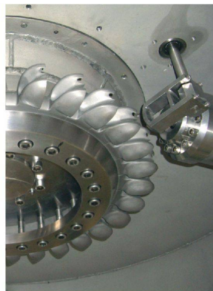
Fig. 6: Vue intérieure.