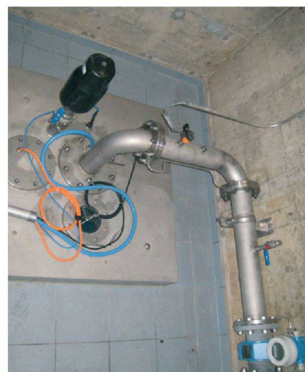
Fig. 8: Vue intérieure.

L'ensemble des installations intérieures a été renouvelé et adapté en fonction des nouvelles directives en matière d'eau potable. Les travaux se sont notamment portés sur le renouvellement de la tête de puits et de la tuyauterie. Le bâtiment a également été assaini et isolé thermiquement (photos 7 et 8).