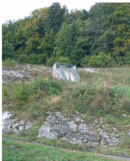
Fig. 1: Vue extérieure.