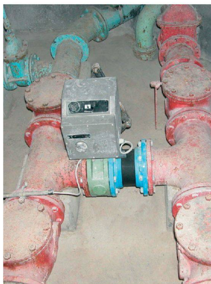
Fig. 3: Etat antérieur.