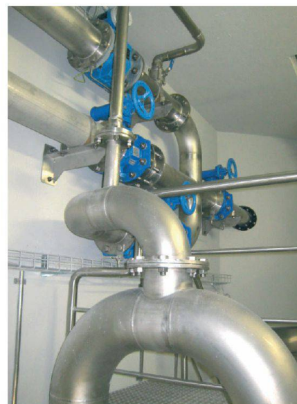
Fig. 4: Etat actuel.

Les installations comprennent également 2 pompes de 11 kW chacune pour l'alimentation de «la Cerniat». L'eau en provenance des captages subit un traitement aux rayons ultraviolets pour garantir une qualité irréprochable (photos 3 et 4).