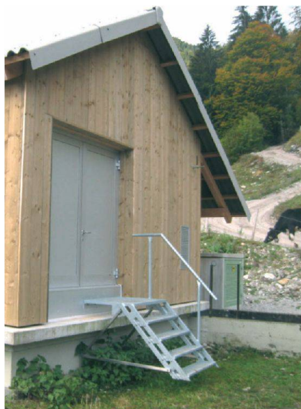
Fig. 5: Vue extérieur.