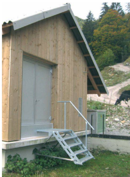
Fig. 5: Vue extérieur.