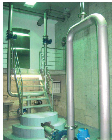
Fig. 2: Vue intérieur.

L'ensemble de l'ouvrage est construit en béton armé étanche. Les parois et le radier des cuves sont spécialement traités pour être résistants et lisses (photos 1 et 2).