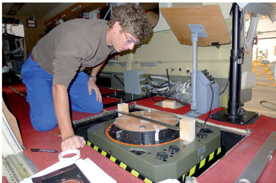
Fig. 1: Matérialisation des axes de coordonnées sur le support de chambre numérique stabilisé par gyroscope PAV30.

La solution de mesure élaborée consiste à placer des réflecteurs au-dessus du centre de l'antenne GNSS et du centre du