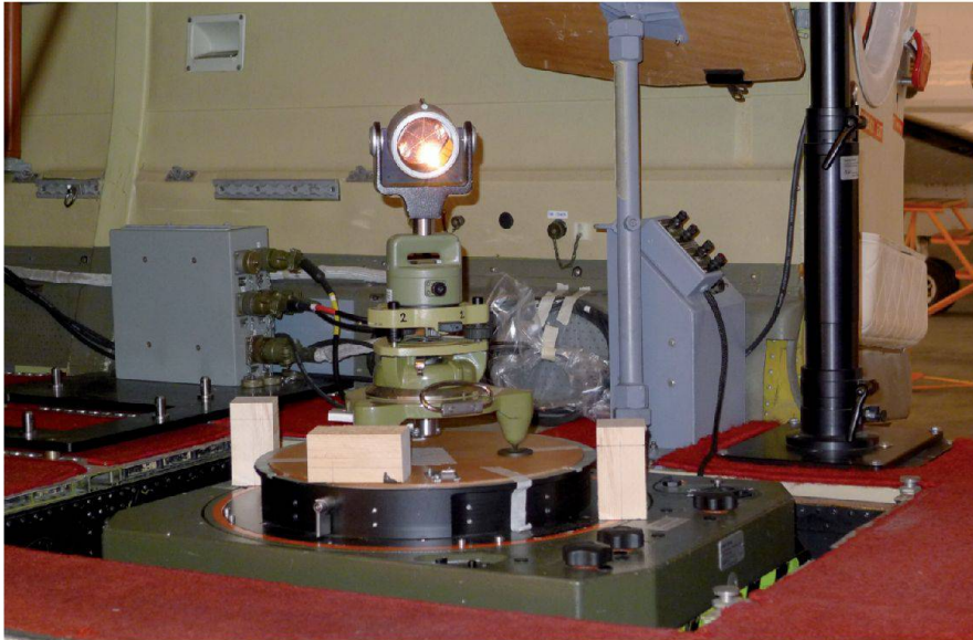
Fig. 2: Le PAV30, l'origine du système de coordonnées local (prisme) ainsi que la matérialisation des axes de coordonnées (blocs en bois).

Abb. 2: Der PAV30, die Herkunft des lokalen Koordinatensystems (Prisma) und die Materialisierung der Koordinatenachsen (Holzblöcke).