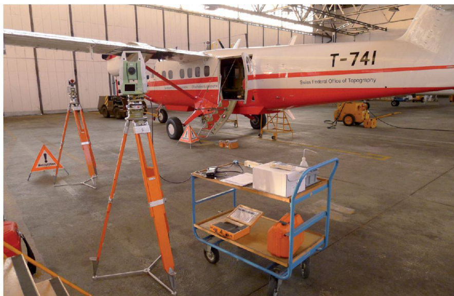
Fig. 5: Mensuration par intersection de directions depuis deux stations. Abb. 5: Vermessung durch Einschnitte der Distanzen von zwei Stationen aus. Fig. 5: Misurazione tramite intersezione delle distanze da due stazioni.

Les contrôles ont montré que les résultats étaient très proches dans anciennes valeurs et qu'il n'y a ainsi pas eu de changement important sur le premier avion. Des différences x , y et z de 8, 1 et 6 centimètres ont par contre été observées sur le second appareil, qui avait subi des réparations, ce qui a confirmé la nécessité de procéder à ces mesures.