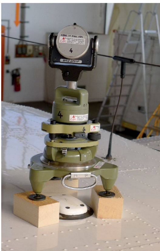
Fig. 4: Prisme au-dessus de l'antenne GNSS.