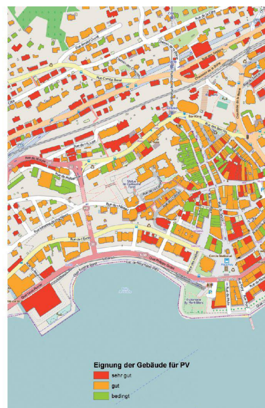
Abb. 3: Ausschnitt der Stadt Neuchâtel. Eignung der Gebäude für Photovoltaik-Anlagen.

Die Ergebnisse der Stadt Neuchâtel demonstrieren das ausserordentlich hohe Potenzial für Solarstrom. Betrachtet man die solaren Einstrahlungswerte der Stadt im Vergleich mit anderen Schweizer Städten, dann weist Neuchâtel eher tiefe Werte auf (siehe Kapitel 3 und Abb. 2). Im Süden, z.B. im Wallis, Tessin und in Graubünden, sind die Einstrahlungswerte bis zu 40–50% höher. Trotz allem könnte der theoretische Ertrag an Solarstrom den Jahresbedarf aller Einwohner der Stadt decken. Eine Solarpotenzialanalyse ermöglicht solche Abschätzungen und hilft einer Gemeinde, weiterführende energiepolitische Konzepte abzuleiten. Im weiteren Sinne stellt die Analyse auch eine Planungshilfe und neutrale Information für Installateure, Energieberater und Banken dar. Durch Veröffentlichung der