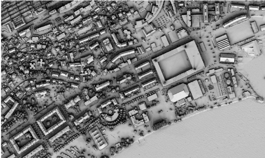
Abb. 1: Digitales Oberflächenmodell der Stadt Neuchâtel.

Stromerzeugung in Betracht kommen, auch für die Wärmegegewinnung nutzbar.