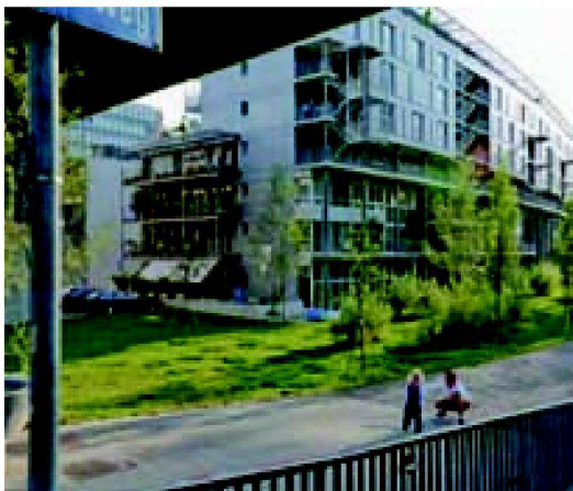
Fig. 2: «Les espaces non construits en milieu urbain ont des fonctions indispensables, notamment dans les espaces suburbains.»

lungsebenen erfolgen. Durch übergeordnete partizipative Planungsprozesse können die einzelnen Parteien gezielt in den Planungsprozess einbezogen werden, um