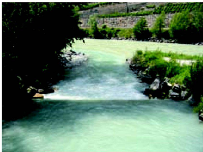
Fig. 1: Embouchure de la Borgne canalisée dans le Rhône en Valais: au premier plan, le seuil faisant obstacle à la remontée des poissons.