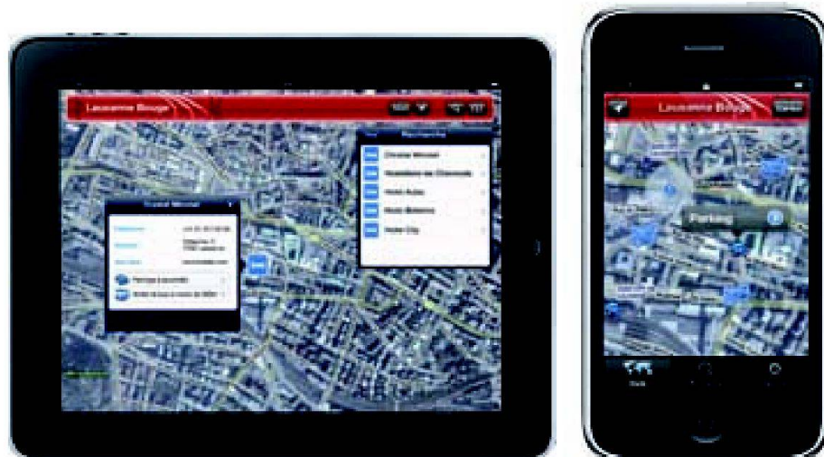
Fig. 1: Aperçu de l'interface de l'application sur iPad et iPhone.

Malgré tout, l'architecture de l'application n'allait pas de soi: Lausanne possède les bases de données adéquates sur une plate-forme ESRI. Il fallait donc faire en sorte de pouvoir se connecter sur la Géo-database, en extraire les données, puis afficher les ponctuels et le fond de plan associé. Comme il n'était pas question de réinventer la poudre, arx iT a tout simplement fait appel à des solutions existantes proposées par ESRI: «Nous avons opté pour une API Flex sur plate-forme web, explique Frédéric Humbert-Droz, chargé du développement de l'application, afin de garantir un bon niveau d'interactivité et de convivialité. Pour les plates-formes iPhone et iPad, où Flash ne fonctionne pas, par décision délibérée d'Apple, il a fallu recréer cet environnement. L'API ArcGIS for iOS se charge de l'affichage et du mouvement des fonds de plan, ainsi que du rapatriement des données. Le reste est pris en charge par des objets Cocoa Touch, le système graphique d'Apple intégré à l'iOS. L'architecture a été complètement développée sous la forme de géo-services web de manière à concentrer toutes les fonctionnalités du côté du serveur. Ainsi, poursuit David Beni, quel que soit le terminal de consultation, la partie développée spécifiquement est extrêmement réduite.»