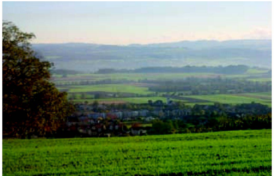
Abb. 1: Hecken und Obstgärten prägen das Landschaftsbild von Boswil (AG).

Nicht nur die Bodennutzung wurde untersucht, sondern auch die einzelnen