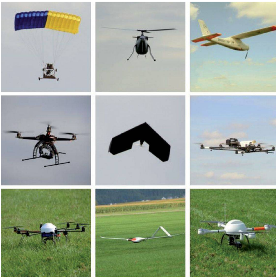
Abb. 1: UAVs, welche bei der Live-Demonstration vorgestellt wurden.

Zusätzliche Informationen unter www.uav-g.ethz.ch sowie bei Dr. Henri Eisenbeiss, ETH Zürich, Institut für Geodäsie und Photogrammetrie, Tel. +41 44 633 32 87, henri.eisenbeiss@geod.baug.ethz.ch