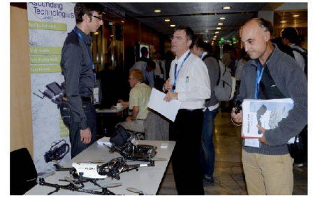
Abb. 2 und 3: Exhibition während der UAV-g Konferenz.

technische Neuerungen und formulierten Nutzerbedürfnisse. Der Schwerpunkt der UAV-g 2011 lag auf den Forschungsaktivitäten in verschiedenen Disziplinen: Künstliche Intelligenz, Robotik, Photogrammetrie, Vermessung, Computer Vision, Luftfahrtingenieurwesen. Im Hinblick auf die Geomatik wurde gezeigt, was «State of the Art» ist und welche Herausforderungen in der Zukunft angegangen werden müssen, um UAVs noch erfolgreicher in der Geomatik einsetzen zu können.