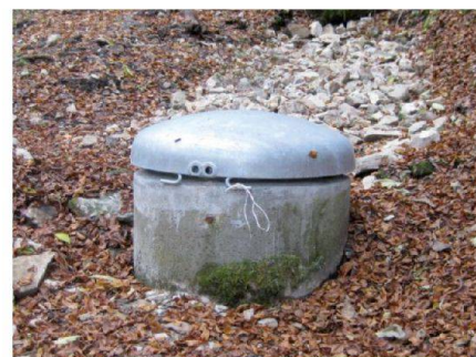
Fig. 5: Captage après assainissement.

Le projet prévoit environ 6000 places pour le gruyère et 1500 places pour le vacherin, pour un coût d'environ 4.2 millions de francs. Le projet sera réalisé en communauté avec la Société de laiterie de Charmey qui construira pour son compte une cave d'environ 3000 places de gruyère et le local de fabrication.