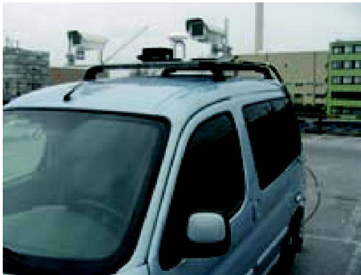
Abb. 2: Forschungsplattform Mobile-Mapping-IVGI mit Inertialmesseinheit (schwarzer Kubus), GPS-Antenne und Stereo-Bildsensoren.

matik) 22 Studierende (davon 7 weiblich) ihr Studium auf. Aktuelle Informationen zum Studium im BSc in Geomatik sind zu finden unter www.fhnw.ch/habg/ivgi/bachelor . Parallel zum BSc in Geomatik startete Mitte September der zweite Kurs des dreisemestrigen Master of Science in Engineering mit der Vertiefungsrichtung Geoinformationstechnologie (MSE-GIT). Aktuelle Informationen über Inhalte und Struktur des Masterstudiums in Geoinformationstechnologie sowie zu Anforderungen und Anmeldung sind auf der Studiengangsw Webseite www.fhnw.ch/habg/ivgi/master zu finden.